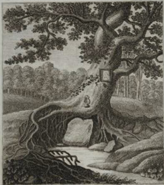
Rein und still wie die Fluthen des Jungfrauenstroms am Hebel fliehe das Leben. Wir han, unter gnedigem Schutz. Hammer.