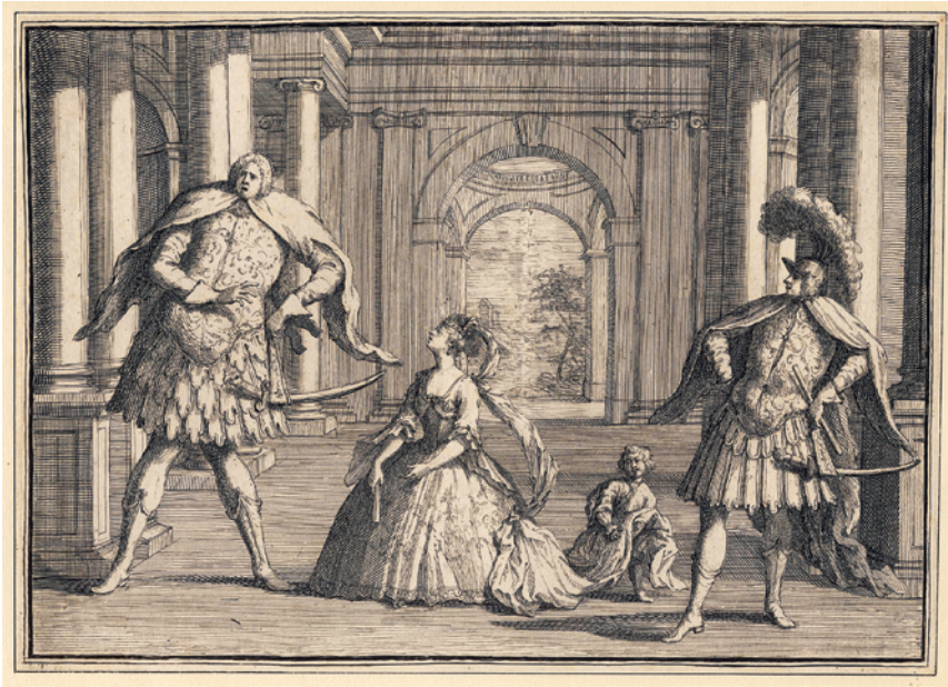
Abb. 1: John Vanderbank: Karikatur einer Aufführung von Händels Flavio , um 1723

Zu sehen sind die Kastraten Gaetano Berenstadt und Senesino, zwischen ihnen die Primadonna Francesca Cuzzoni. Ob hier eine Szene aus Händels Flavio (1723) oder Ariostis Coriolano (1723) abgebildet ist, wie diskutiert wurde, 15 spielt für den gegebenen Zusammenhang im Grunde keine Rolle, da es in diesem Stich weniger um die realistische Wiedergabe einer Bühnensituation als um die zugespitzte Portraitierung der drei prominenten Gesangsstars geht. Dieses Beispiel lässt zugleich deutlich erkennen, dass die Szenerie zwar akkurat, aber nachrangig gehandhabt wird.