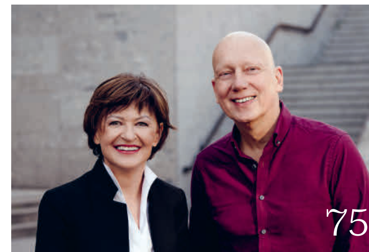
Diese Seite (v.o.n.u.): AI Slop Iva Krtalić und Erk Simon Linke Seite (v.o.n.u.): Katharina Kärigel Der freie Wille (2006)