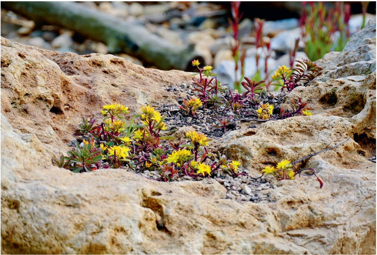
Selbstständige Pflanzen wie dieser Mauerpfeffer machen Mauern lebendig und bunt.

hingestellt, wo die Art eigentlich wachsen soll: bei mir die Akelei aus dem Garten auf die gepflasterte Fläche vor der Haustür. Dort lässt man sie blühen, fruchten und sich versamen, den Topf vielleicht auch mal über die Fläche wandern, sodass überall etwas hinkommt. Einige Samen werden sicherlich ein passendes Plätzchen finden, erleichtern Sie es ihnen, indem Sie die Fugen in dieser Zeit schön feucht halten und andere junge Pflänzchen, die da auch gerne wachsen würden, entfernen. Sie wollen Akelei und basta.