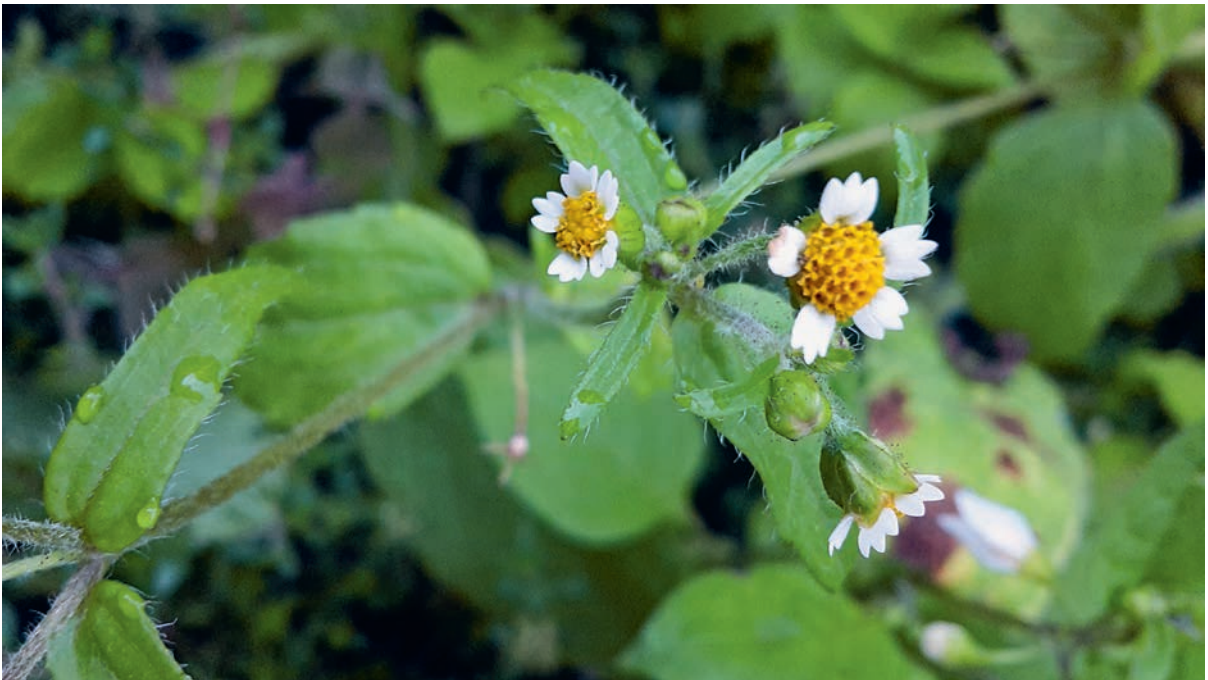
Sehr selbstständig im Gemüsebeet oder auch in den Pflasterfugen unterwegs: Franzosenkraut, das gemeinhin als störendes Un-Kraut gilt – und lecker schmeckt.

Aber: »Man sieht nur, was man weiß« – dieses Zitat stammt sinngemäß von Goethe. Und je mehr man weiß, desto mehr sieht man. Wir werden sehen, welche Pflanze sich wo ansiedelt, und mit dem Wissen, wie sie dahin gekommen ist, werden wir sie auch woanders viel besser hinlocken können. Oder umgekehrt, Sie werden erfahren, wie Sie ihr beikommen, wenn sie da eigentlich gar nicht hin sollte. Denn, wer mit so offenen Armen gärttert, wird natürlich Pflanzen im Garten treffen, die