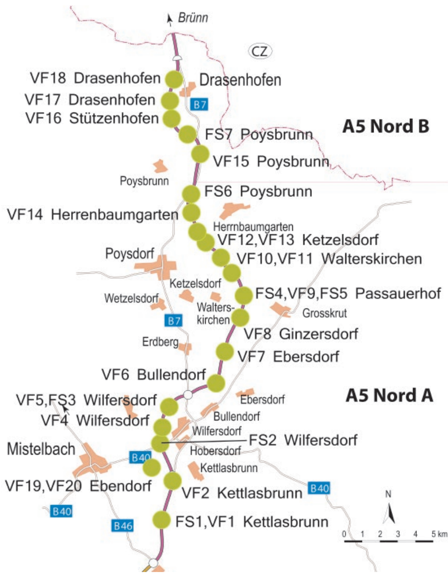
Abb. 1: Trassenplan des Nordabschnitts der A 5 Nord/Weinviertel Autobahn.

tobahntrasse durchquert werden, vorgestellt werden. So soll gezeigt werden, wie viel die – für sich allein stehenden – Erkenntnisse der Einzeluntersuchungen zur Beantwortung offener Forschungsfragen beitragen können – etwa zur ersten sesshaften Besiedlung des zentraleuropäischen Raumes im 5. Jahrtausend v. Chr. oder zu historischen Prozessen