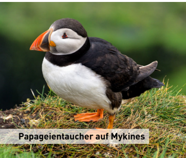
Papageientaucher auf Mykines

Besonders intensiv ist das Erlebnis, wenn man zu Fuß zu den atemberaubenden Steilklippen wandert oder die einsamen Täler durchstreift. Draußensein in der windigen Welt des Nordatlantiks, wo Nebel und Sturmmöwen uns herausfordern. Wo man auf uralten Pfaden wandelt, die früher die einzigen Zugänge ins Nachbardorf gewesen sind, abgesehen von den heute zum UNESCO-Kulturerbe zählenden Klinkerbooten. Das Wellenmeer kostete so vielen Männern das Leben. Kein Wunder, dass man hier eine Melange aus starkem Glauben findet. Etwa 80 Prozent der Bevölkerung sind Mitglied der evangelisch-lutheranischen Kirche. Doch auch die nach dem Einzug der elektrischen Beleuchtung verblassenden