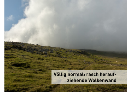
Völlig normal: rasch heraufziehende Wolkenwand

✓ Eins ist sicher: Das Wetter ist überall anders, unvorhersehbar und windig. Die Klimaoase am 62. Breitengrad liegt in der maritimen Subarktis und ist überwiegend mild. Während im Sommer die Durchschnittstemperatur etwa 13 Grad Celsius beträgt, sind es im Winter drei. Das bedeutet aber nicht, dass man nicht an einem Tag mal kurz alle Jahreszeiten um die Ohren geweht bekommt. Vor allem dann nicht, wenn man Berge erklimmt. Ab etwa 150 Höhenmeter gilt das Klima als arktisch, da die Durchschnittstemperaturen die zehn Grad Celsiusmarke nicht übersteigen. So kann es sein, man wandert im eisigen Frost hinauf und schlenkert bei plötzlichen 25 Grad hinab, nicht ohne zwischendurch vom Regenschauer durchweicht oder vom Nebel eingehüllt worden zu sein. Um sich etwas vorzubereiten, zieht man am besten mehrere Quellen zu Rate. Bewährt haben sich yr.no, windy, faroeislandslive, portal.fo/ vedrid; wobei es sich lohnt auf die Windrichtung zu achten: tendenziell ist in der Ursprungsrichtung die Wahrscheinlichkeit von Regen und Wolken höher.