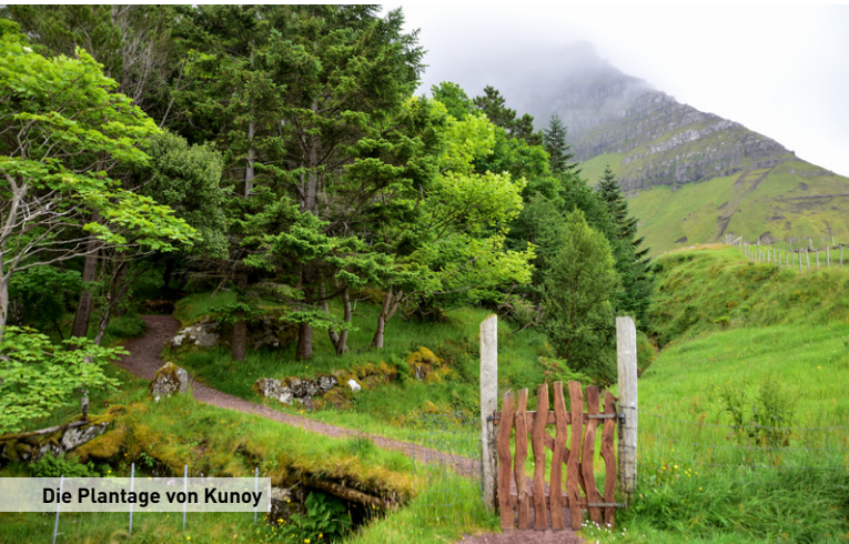
Die Plantage von Kunoy

✓ Die Inseln wirken kahl. Und doch gibt es sie: Bäume und sogar Wälder. Die Mindestgröße für einen Wald von einem Hektar erfüllen beispielsweise die Plantagen in Tórshavn und Tvøroyri auf Suðuroy. Vor Jahrhunderten gab es Wälder aus Weiden-Arten, Wacholder und Moorbirken. 1904 gelang erstmals die Neuanpflanzung eines Wäldchens in der Hauptstadt. Heute gibt es in vielen Dörfern eine kleine Baum-Oase, die als Mini-Naherholungsgebiet dient und wo so manche Romanze begann. Viele Gebäude wurden früher mit Treibholz gebaut, das vor allem aus Sibirien, Norwegen, Kanada und von zerborstenen Schonern stammte. Eines der weltweit ältesten Holzhäuser findet man an der Westküste Streymoys, dessen älteste Balken wurden um 1350 verbaut.