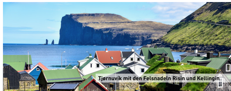
Tjørnuvík mit den Felsnadeln Risin und Kellingin

Aus Gründen der besseren Lesbarkeit wird auf eine geschlechtsneutrale Differenzierung verzichtet. Entsprechende Begriffe gelten im Sinne der Gleichbehandlung grundsätzlich für alle Geschlechter. Die verkürzte Sprachform beinhaltet keine Wertung.