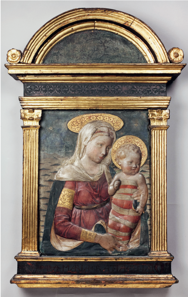
6 Neri di Bicci (Fassung), Desiderio da Settignano (Vorlage des Gipsabgusses), Madonna mit Kind (sog. Madonna Romoli-Martini dell'Ala ), 1465 (Fassung), gefasster Gipsabguss, Berlin, Staatliche Museen zu Berlin, Bode-Museum

den sind und sich trotzdem in verblüffender Art und Weise ähneln. Dass hier allerdings bisweilen Skepsis angebracht ist, machen die in diesem Band von Aleksandra Lipińska, Wolfram Kloppmann und Thomas Hildenbrand vorgestellten Untersuchungen des interdisziplinären Forschungsteams Materi-A-Net deutlich, die den Verdacht nahelegen, dass besonders ähnliche Werke sich als Fälschungen entpuppen könnten.