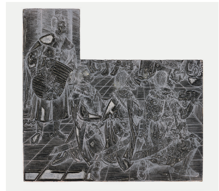
8–10 Hans Springinklee (Entwurf) Claus Seeman (Formschnitt), Holzstock für den Weißkunig Kaiser Maximilians I. mit drei Teilstücken: Die Gesandten von Portugal werben um die Hand der Prinzessin Eleonore; Die Gesandten von Dänemark werben um die Hand der Prinzessin Isabella, Die Gesandten von Ungarn werben um die Hand der Prinzessin Maria, Wien, Albertina

ten eines Kupferstiches nicht nur zur Erweiterung des individuellen Portfolios, sondern konnten sogar unterschiedliche Bildgattungen adressieren. Konrad Krcal führt in seinen Überlegungen zur transformativen Allegorese vor, wie eine Kupferplatte zu einem prestigeträchtig illustrierten Thesenblatt zu Ehren des noch unmündigen Ludwigs XIV. nach der Überarbeitung zur Illustration eines Almanachs werden, mithin mit der materiellen Veränderung auch einen Wechsel zwischen den Genres vollzogen werden konnte.