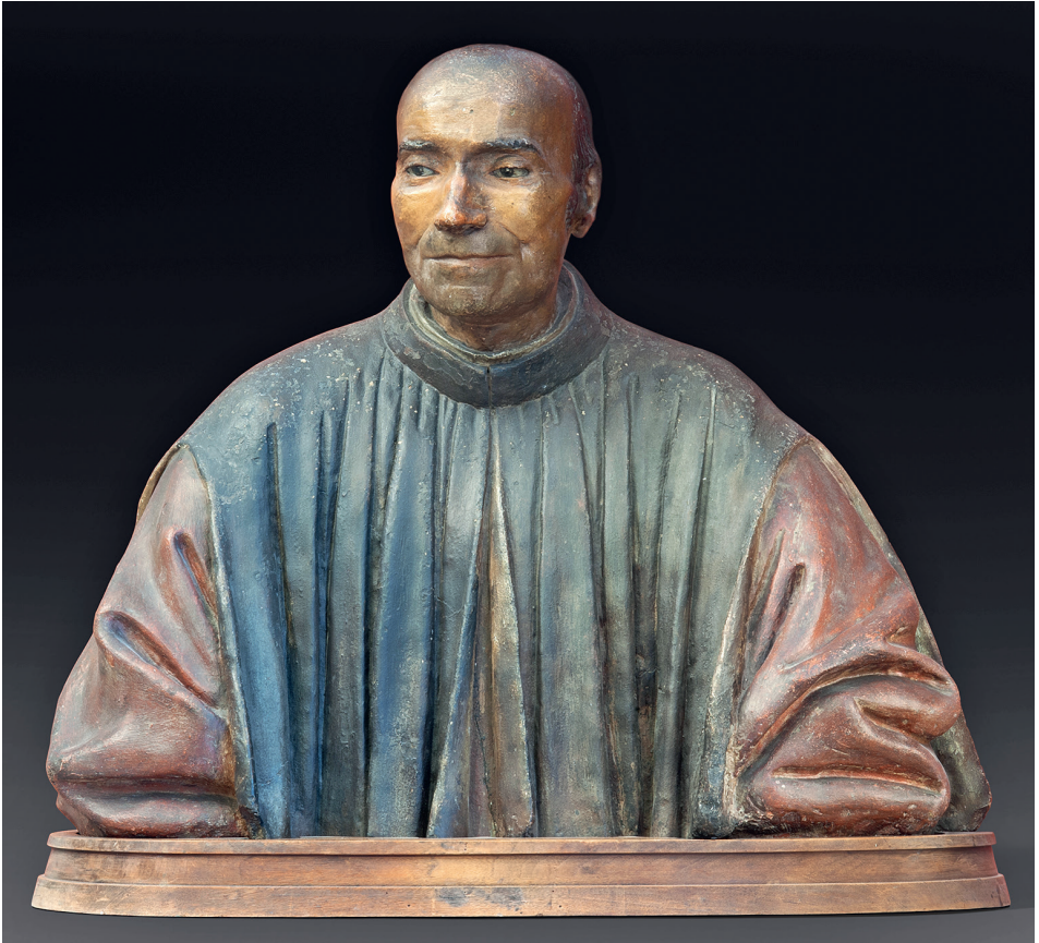
7 Unbekannter Künstler, Büste des Palla di Bernardo Rucellai , um 1520/1530, gefasster Gips (mit Gesichtsbeguss), Berlin, Staatliche Museen zu Berlin, Bode-Museum

Oberfläche manifestieren. Zum anderen hinterließ bei mehrfach verwendeten Gussformen ebenfalls das Alter seine Spuren. Durch den Gebrauch kam es zu Ausbrüchen; feine Vertiefungen setzten sich zu und verunklärten Details. Bei direkten Abformungen ersetzen oft Abgüsse die nicht mehr verfügbaren „Urbilder“ und gaben so Fehler und Ungenauigkeiten weiter. Paul Hofmanns detailscharfe Untersuchung der Beziehung zwischen zwei im Bode-Museum in Berlin befindlichen Madonnenreliefs aus Ton und einem in Boston aufbewahrten Kalksteinreliefs mit demselben Motiv macht deutlich, welche Spuren bei einer wiederholten Abformung entstehen können und wie ihre Identifizierung zur Rekonstruktion der Genealogie eingesetzt werden kann. Negative vom (dreidimensionalen) Negativ finden sich aber auch in druckgraphischen Verfahren – nämlich dann, wenn der hölzerne Druckstock seinerseits abgegossen wird. Auf ein frühes Beispiel für diese Schnittstelle zwischen den Verfahren weist Livia Cárdenas in ihrem Beitrag hin: Um hohe