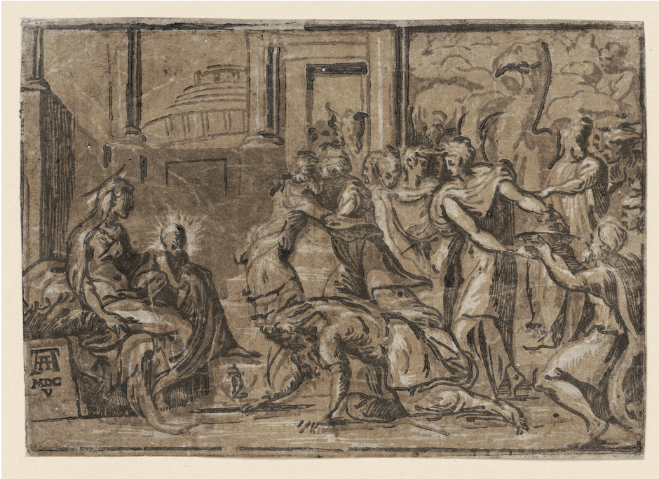
11 Niccolò Vicentino nach Parmigianino, Anbetung der Könige , um 1540/50, (Druck Andrea Andreani, 1605), Holzschnitt von drei Platten in Grau, Gelbbraun und Graubraun, Berlin, Staatliche Museen zu Berlin, Kupferstichkabinett

Eine andere Form der Aneignung bildete die Einbindung vervielfältigter Objekte in neue Zusammenhänge. Walter Cupperi stellt in seinem Beitrag Beispiele vor, bei denen die Neuverwendung mit einer materiellen und medialen Transformation einhergegangen ist und aus Kleinreliefs Medaillen und umgekehrt aus Medaillen Zierelemente geworden sind. Bei den Florentiner Madonnenreliefs schließlich war die Nachbehandlung ein Distinktionsmerkmal, das umso wichtiger wurde, als die Grundkonstellation – die halbfigurige Maria mit Kind – wenig gestalterischen Spielraum bot. 25 Neben den hier ohne große Mühe umzusetzenden Veränderungen an den plastischen Formen war es vor allem die Bemalung, 26 die aus einem Abguss ein vollständiges und funktionsfähiges Objekt sowie ein konkurrenzfähiges Einzelstück machte. Die Kombination aus Relief, Farbe und Gold verlieh den Madonnen unmittelbare körperliche Präsenz, schließlich sollten die gerahmten Reliefs, in Quellen des 15. Jahrhunderts als „cholmi“ und „tabernacholi“ bezeichnet, 27 die lebendige Anwesenheit von Jungfrau und Kind glaubhaft machen. Giancarlo Gentilinis Bezeichnung solcher Werke als „pittura a rilievo“ lenkt den Blick auf den Anteil der Maler:innen an der Gesamtwirkung. 28 Angesichts der Erwartungen an Andachtsbilder, der Sehgewohnheiten und der frühen Madonnenreliefs aus Terrakotta stellt sich die Frage, ob tatsächlich stets Marmorreliefs am Beginn einer Reproduktionsserie stehen müssen; grundsätzlich könnte