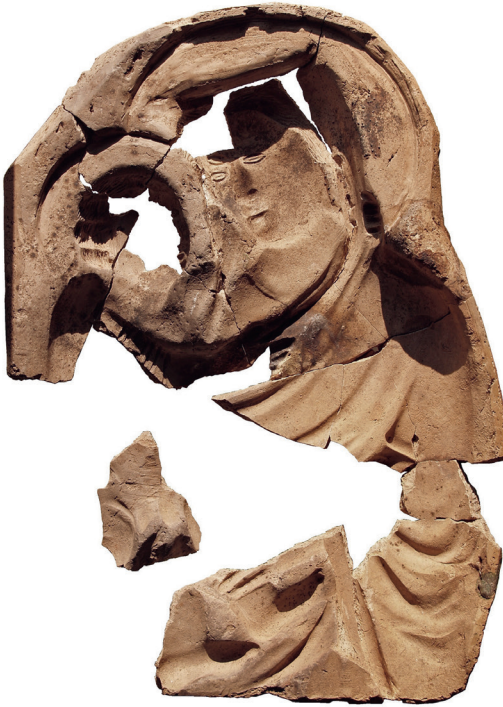
4 Model mit Madonna und Kind Anfang 16. Jahrhundert, Terrakotta, 54 x 37 cm, Grabungsfund in Košice, Dominikánske námestie No. 11