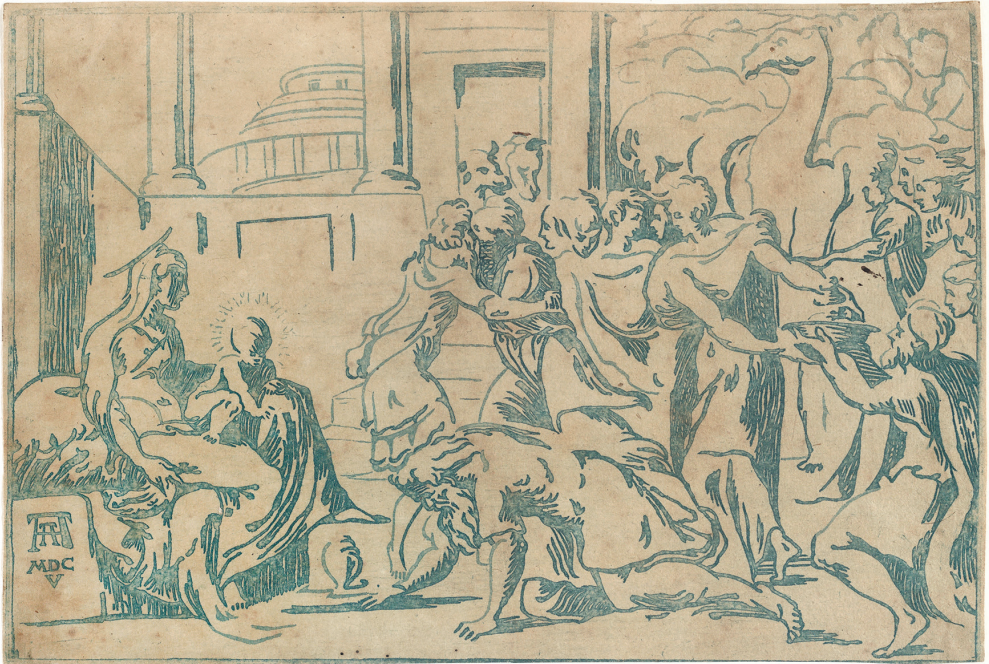
12 Niccolò Vicentino nach Parmigianino, Anbetung der Könige , um 1540/50, (Druck Andrea Andreani, 1605), Holzschnitt von der Strichplatte in Blau, New York, Metropolitan Museum, Harris Brisbane Dick Fund

das ‚Urbild‘ eines Abgusses auch ein Tonmodell oder ein zur Bemalung bestimmtes Relief aus Terrakotta gewesen sein.