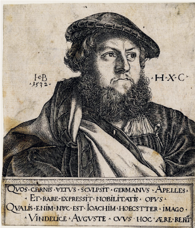
3 Jacob Binck, Bildnis Joachim Hoehstetter , 1532, Kupferstich, London, British Museum

Bei dreidimensionalen Abformungen spielte die Arbeitsteilung eine deutlich geringere Rolle. Die Herstellung der Negativformen fiel weitgehend in die Kompetenzen der Bildhauer, und so wurden die Model für Wachs- oder Tonobjekte, Negativformen von Reliefs oder Gussformen für kleinere Bronzefiguren und Medaillen in der Regel in den gleichen Werkstätten gefertigt wie die Modelle. Lediglich bei großformatigen oder vollplastischen Arbeiten übernahmen diese Aufgabe Gießer, die dann allerdings mit ihren Definitionen von Teilformen durchaus die Formgebung beeinflussen konnten. Insgesamt waren bildhauerisches ‚Urbild‘ und abgeformtes Bild auf eine andere Art und Weise miteinander verbunden als Entwurf und gedrucktes Bild, weil man hier nicht ausschließlich mit singulären, in ihrer Haltbarkeit begrenzten Matrizen arbeitete, sondern von jedem Positiv, jeder abgeformten Form neue Negativformen herstellen und so eine ganze Kette mechanisch geschaffener Vervielfältigungen in Gang setzen konnte. Bisweilen entstanden derartige Abformungen bald nach dem ‚Urbild‘, bisweilen wurden sie aber auch deutlich später angefertigt. Zeitliche Nähe ist etwa für die vervielfältigten Florentiner Madonnenreliefs des Quattrocento anzunehmen, die gern als Paradebeispiel für eine frühneuzeitliche „Serienproduktion“ plastischer Bildwerke angeführt werden. 8 Ihr ‚Urbild‘ bestand entweder aus Ton oder Marmor und wurde dann mit Hilfe eines hiervon gewonnenen