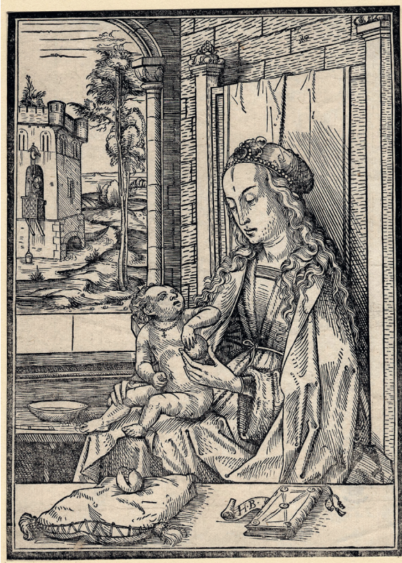
1 Hans Burgkmair und unbekannter Formschneider, Muttergottes am Fenster , um 1500–1505, Holzschnitt, London, British Museum