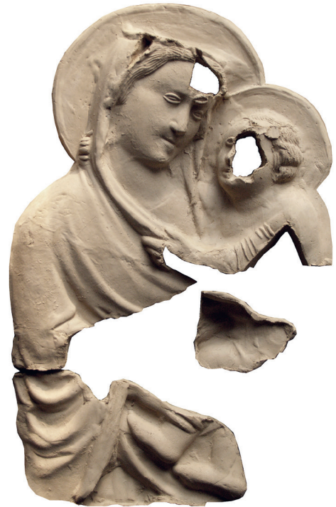
5 Moderner Tonabdruck des Modells

Negativs aus Gips oder Terrakotta in verschiedenen Materialien wiederholt. Solche Formen haben sich in der Regel nicht erhalten; eine Ausnahme ist das Fragment eines Terrakotta-Modells, das 2011 im slowakischen Košice ausgegraben wurde (Abb. 4, 5). 9 Modell und Abformung konnten – zumindest bei den Florentiner Beispielen – auch aus einer Hand stammen. So scheint der Maler Neri di Bicci etwa in den 1450er Jahren unter anderem von dem Bildhauer Desiderio da Settignano Abgüsse bezogen zu haben, um sie zu bemalen und sie so in ganz eigene, deutlich vom Ausgangspunkt abweichende Artefakte zu verwandeln (Abb. 6). 10 Abgüsse von Reliefs, die augenscheinlich oder nachweislich auf Kompositionen von Donatello, Desiderio da Settignano, Antonio Rossellino und Andrea del Verrocchio zurückgehen, sind hingegen über viele Jahrzehnte hinweg wiederholt worden. 11 Ein eigenes Feld bilden die Toten- oder Lebendmasken, 12 die eigentlich anlassbezogen, also für die Herstellung von Porträtbüsten aus plastischen Materialien angefertigt wurden (Abb. 7). Dennoch wurden auch sie jahrelang aufbewahrt, damit man nach ihnen im Bedarfsfall neue Bildnisse fertigen konnte. Die Autorität der ‚Urbilder‘ zeigt sich nicht nur bei Abformungen, sondern auch bei Wiederholungen, die händisch hergestellt wor-