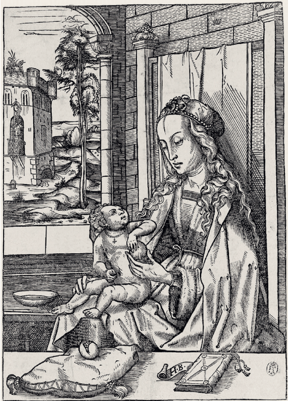
2 Hans Burgkmair und Jost de Negker (?), Muttergottes am Fenster , um 1510 (?), Holzschnitt, Berlin, Staatliche Museen zu Berlin, Kupferstichkabinett