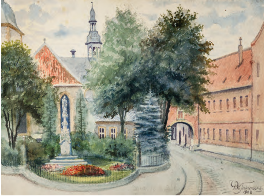
Das Franziskanerkloster, der Marienplatz und die Marienkirche in Wiedenbrück. Wiedenbrück, 1923. Aquarell, 25,5 × 35,5 cm. Kloster Wiedenbrück eG, Wiedenbrück.