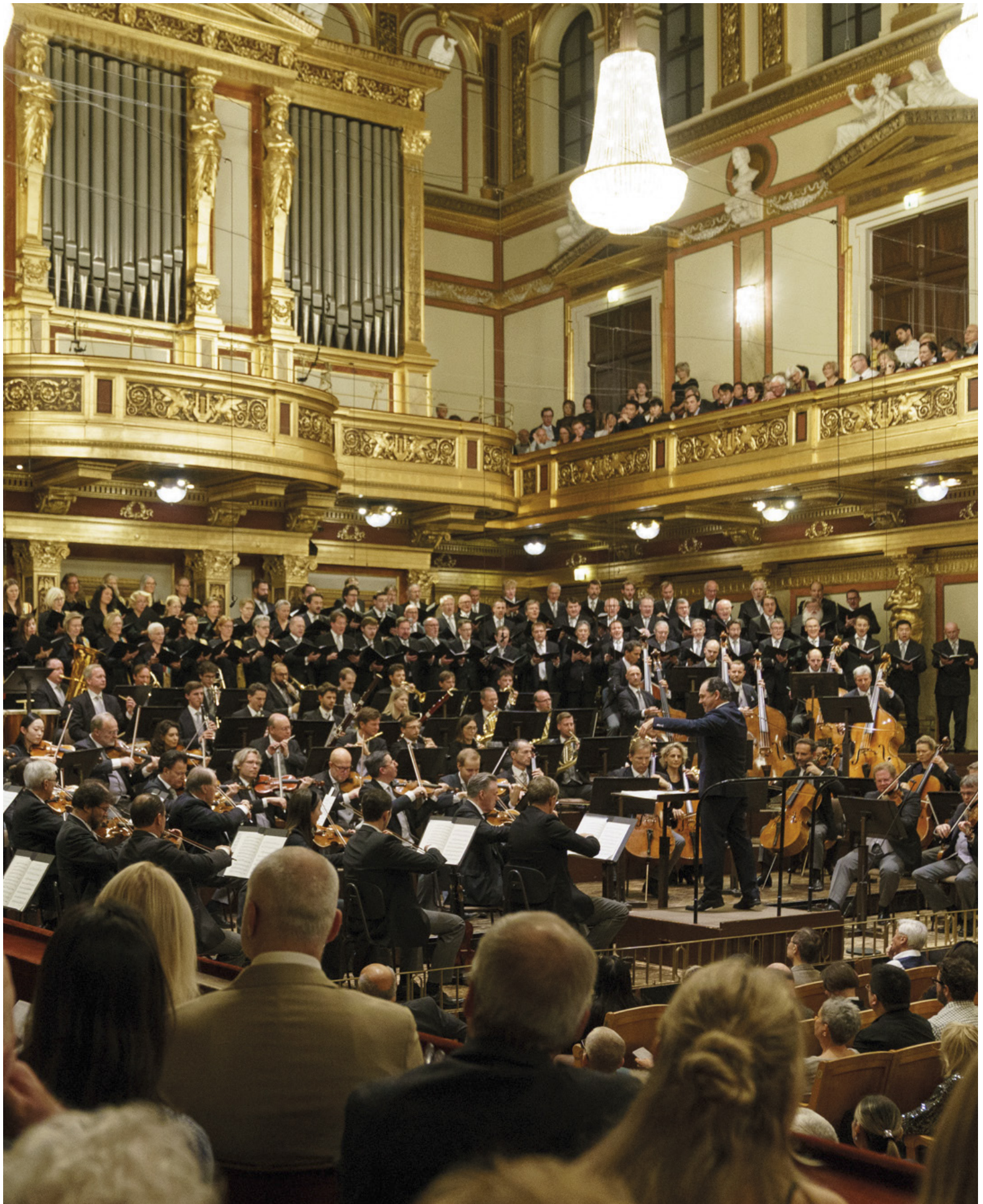
Tugan Sokhiev, Wiener Philharmoniker