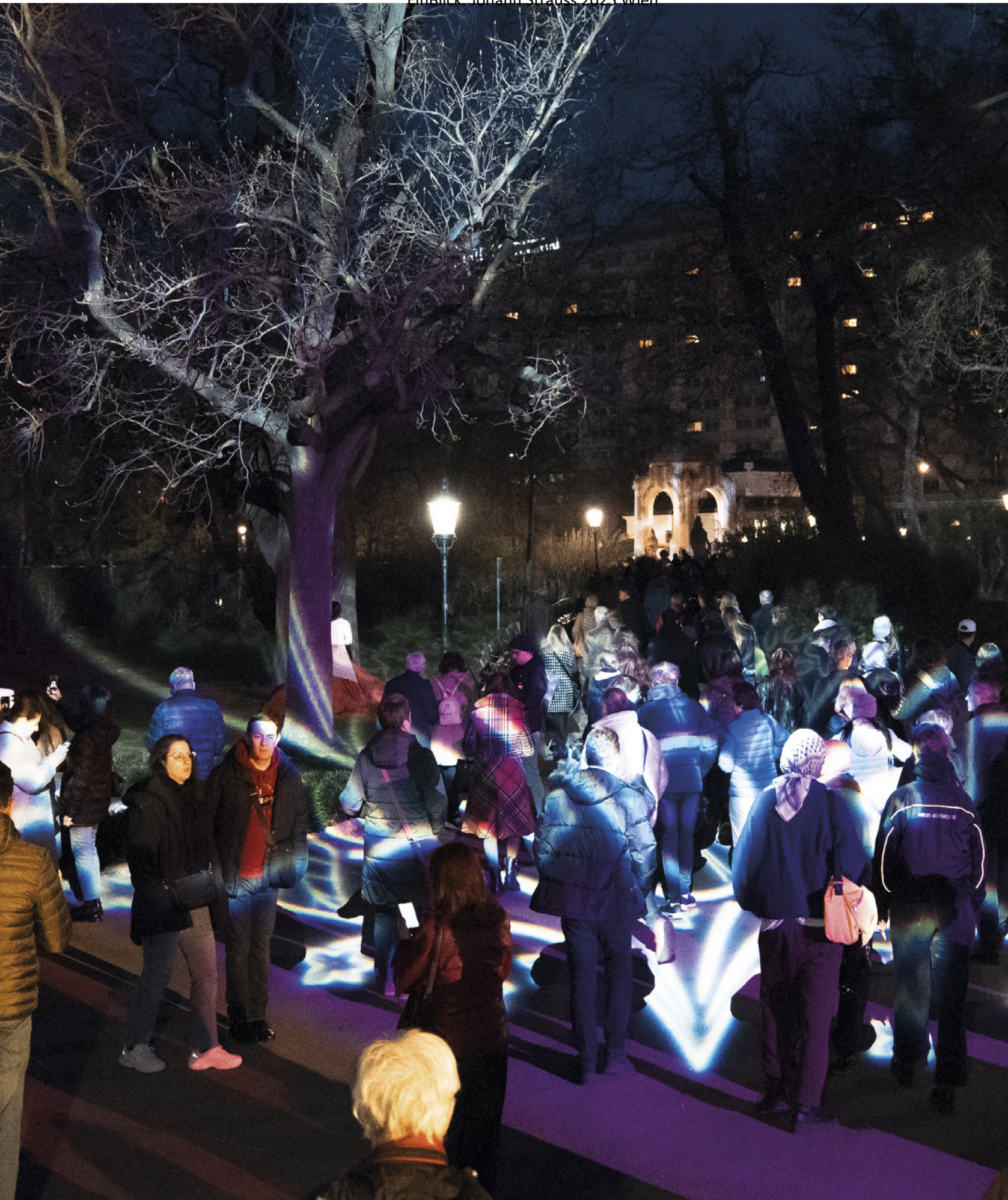
LichtStrauss beim Johann-Strauss-Denkmal im Wiener Stadtpark