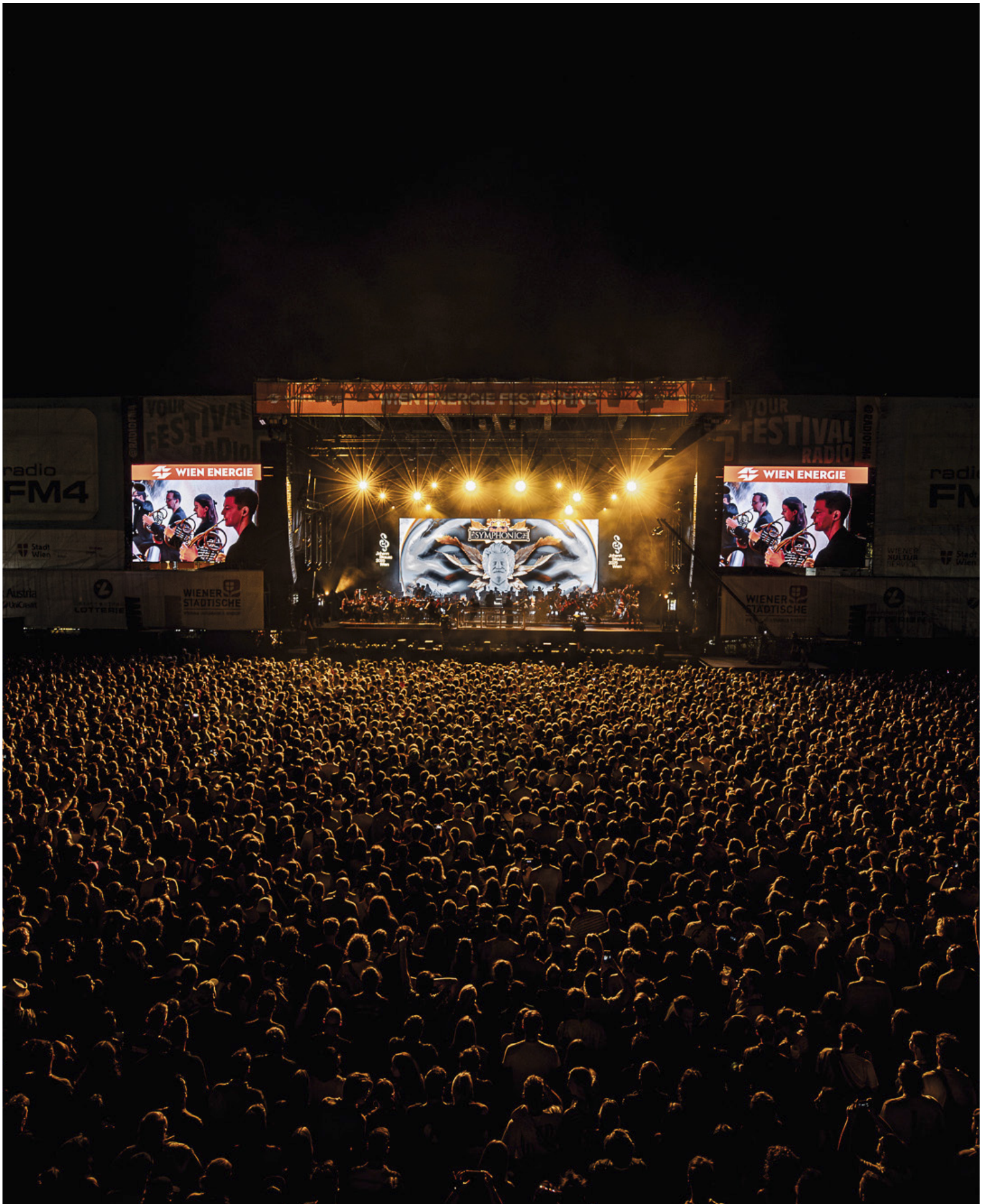
Red Bull Symphonic – Johann Strauss 2025 Edition am Donauinsselfest