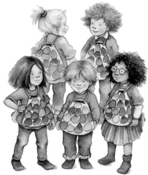
Die anderen Fische