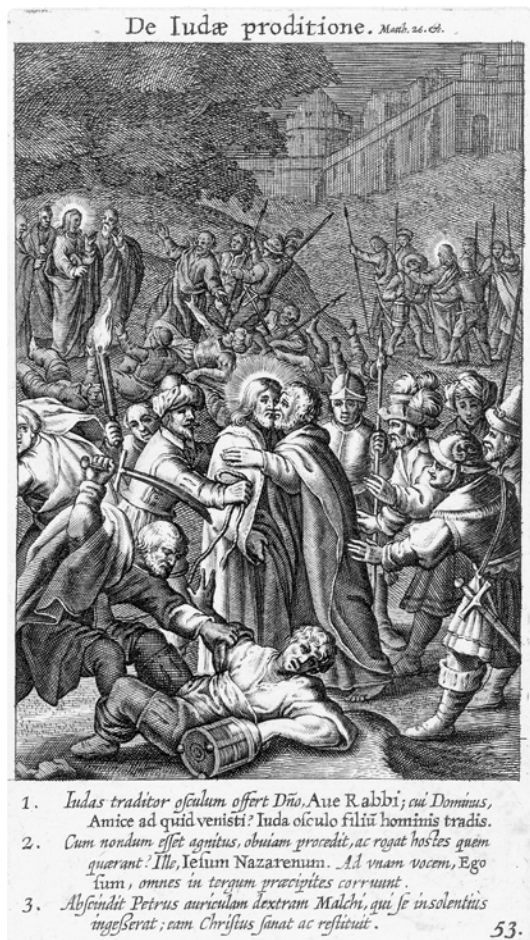
Abbildung 5: Das Bild hat zwei Ebenen, im Hintergrund taumeln die Soldaten, nachdem sich Jesus zu erkennen gegeben hat.