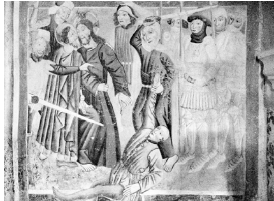
Abbildung 4: Das Gebet auf dem Ölberg (links) und der Judaskuss (rechts), zwei von 46 gotischen Fresken in der Kirche Maria im Stein (Beram), die um 1470 von verschiedenen Künstlern geschaffen wurden. Das erklärt, warum der Judas am Ölberg anders aussieht als der küssende Judas.