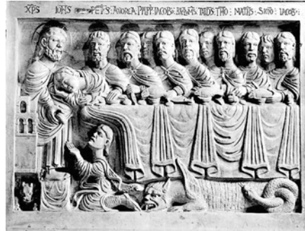
Abbildung 3: Das Relief (ca. 1185–1215) zeigt die sogenannte Judaskommunion.