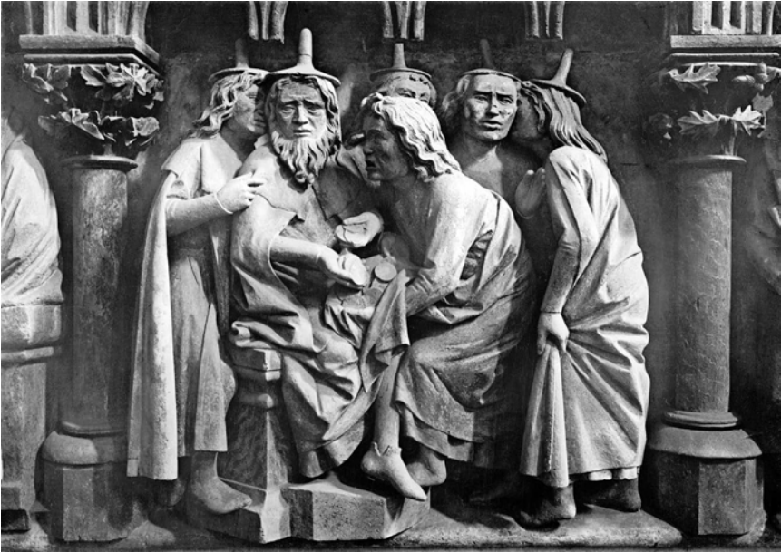
Abbildung 1: Relief (Sandstein) an der Brüstung des Westlettners im Naumburger Dom, um 1250. Die Hohenpriester tragen die seit dem Hochmittelalter üblichen und obrigkeitlich vorgeschriebenen Judenhüte. Eine Assoziation mit dem (durch das christliche Zinsverbot begründeten) Geldverleih durch Juden drängt sich auf. Ohne Frage war das Judas-Motiv Bestandteil des christlichen Antijudaismus.

Lettners des Naumburger Doms gezeigt wurde (Abb. 1) oder in einer Buchillustration aus der ersten Hälfte des 17. Jahrhunderts, die den Vorgang auch schon moralisch kommentiert: Verräther! ist der Schöpffer aller Ding dann nicht mehr werth als dreisig Silberling (Abb. 2). 37