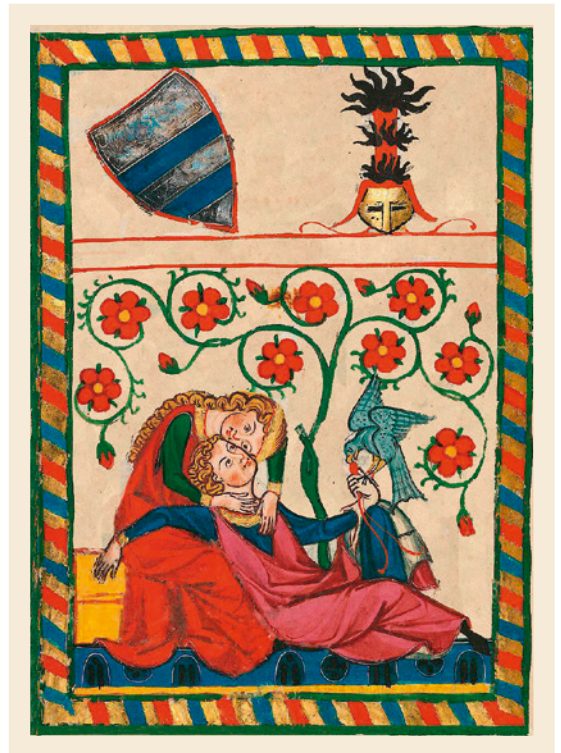
Illustration im Codex Manesse zu Liebesliedern des Minnesängers Konrad von Altstetten, der im 12. oder 13. Jahrhundert gelebt hat.