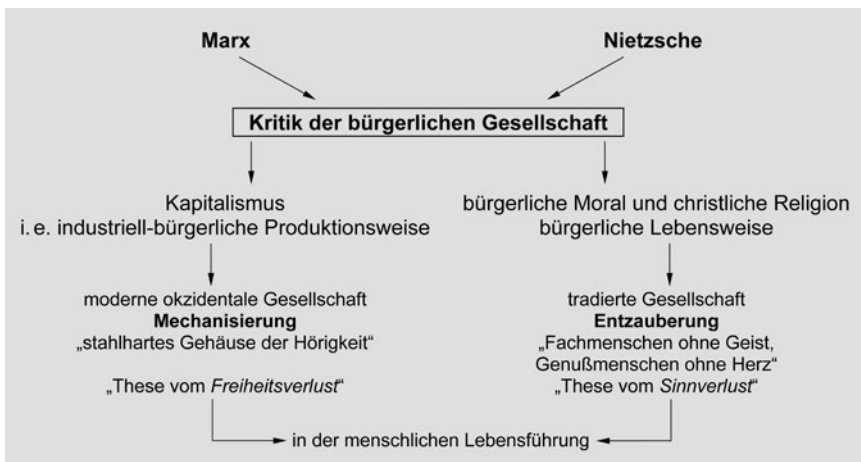
Abb. 1 Das tiefenheuristische Schema zur Werkinterpretation von Max Weber

Dieses tiefenheuristische Schema soll unsere weitere Diskussion anleiten und als roter Faden durch das Labyrinth von Webers Werkarchitektur dienen. Wir werden auf diese zeitdiagnostischen Momente am Ende der Argumentation zurückkommen. Zunächst stellt sich indes die Frage: Wer war Max Weber?