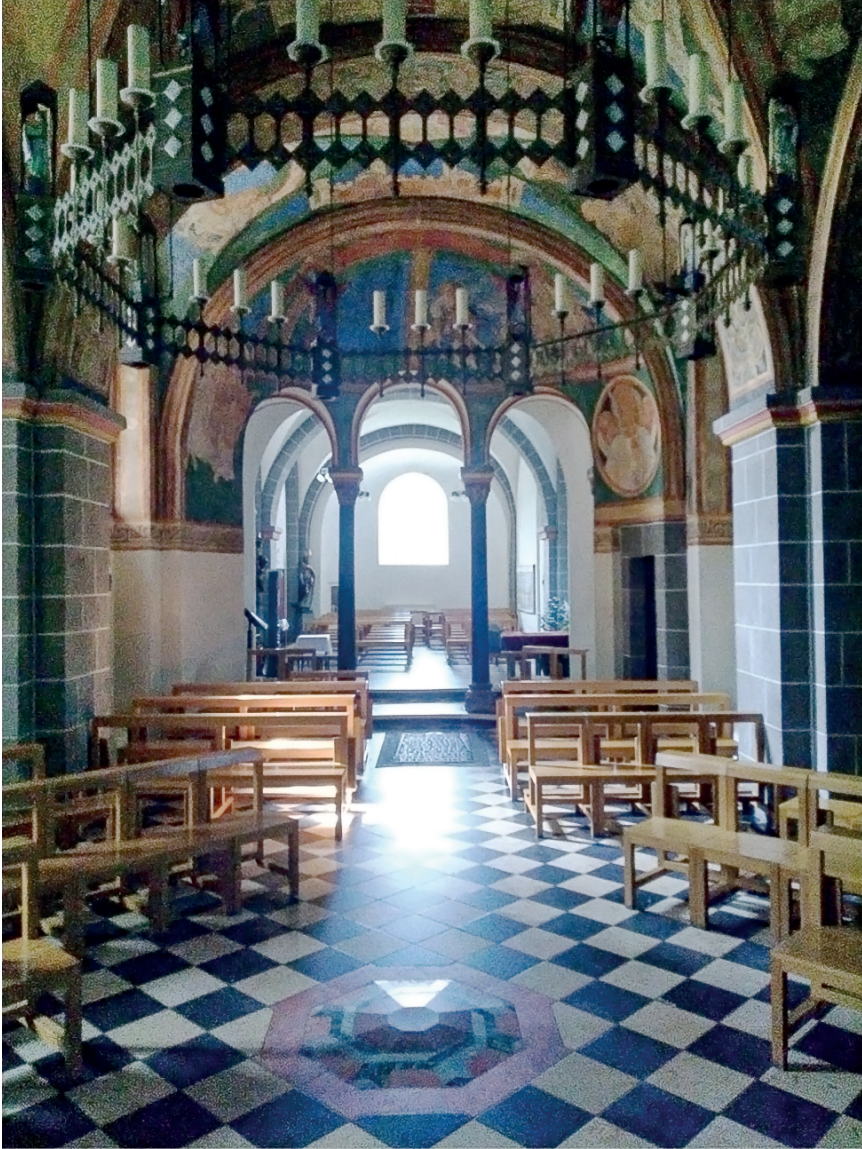
Abb. 4: Die in das Konchenbild der Tempelreinigung einschneidende Drillingsarkade im von der Nachmittagssonne beleuchteten Westarm (Montag, 2. September 2024, 14:25 Uhr).