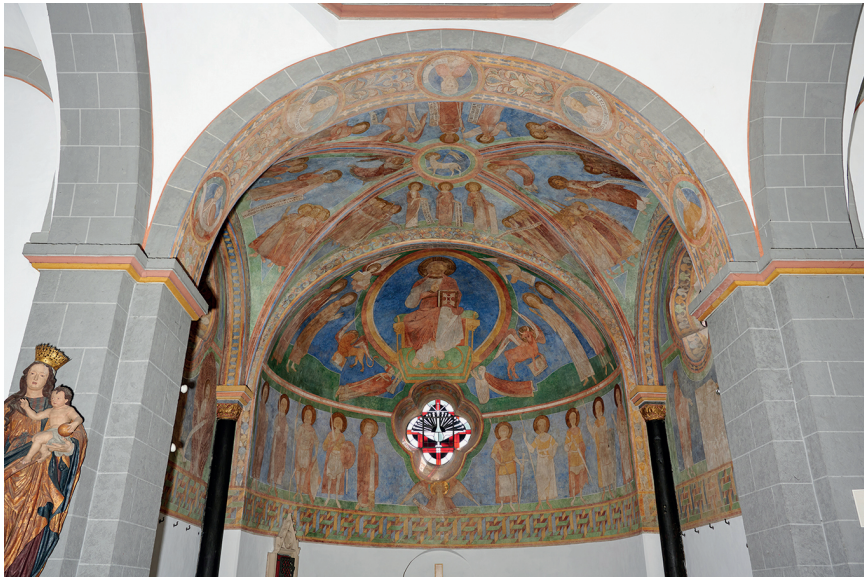
Abb. 3: Blick in den Chor der Oberkapelle.

Deutz, der einen ausführlichen Kommentar zum Buch Ezechiel verfasst hatte. 36 Der Ezechielzyklus wird typologisch mit vier Szenen des Jesuslebens in den Konchen relationiert. Zum anderen besitzt das komplexe Bildsystem Bezüge zur Kreuzzugsbewegung, zur Kirchenreform und zum Investiturstreit, sowie zum Bildungswissen einer gelehrten Elite (siehe dazu auch den Beitrag von Friederike Kalb in diesem Band). 37 Es sind jedoch auch Bezüge auf die Person Hadwigs erkannt worden in der Heiligenreihe der Oberkapellenapsiswand, die bisher ca. 20 Jahre später als die Unterkapellenausmalung datiert wird. 38