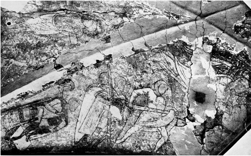
Abb. 1: Essen, Stiftskirche St. Cosmas und Damian, historische Photographie der 1880 zerstörten Wandmalerei im Vorchorjoch, nach BESELER (wie Anm. 24), S. 109, Abb. 84.

Letzterer stammt aufgrund der großen stilistischen Nähe ebenso wie die Wandmalereien des Brauweiler Kapitelsaals höchstwahrscheinlich von derselben Werkstatt wie die Schwarzhündorfer Bilderzyklen und ist in die Zeit um ca. 1155/60 zu datieren. 25 Auch die Essener Kapitellskulptur findet ihre größte Nähe in Schwarzhündorf und in Maastricht, wo Arnold von Wied Propst des Servatiusstifts war. 26 Die letzte Erwähnung Hadwigs als Äbtissin in Essen stammt aus der Zeit um 1170, eventuell war sie jedoch noch deutlich länger im Amt. 27 Ihr Todestag ist der 4. Juni,