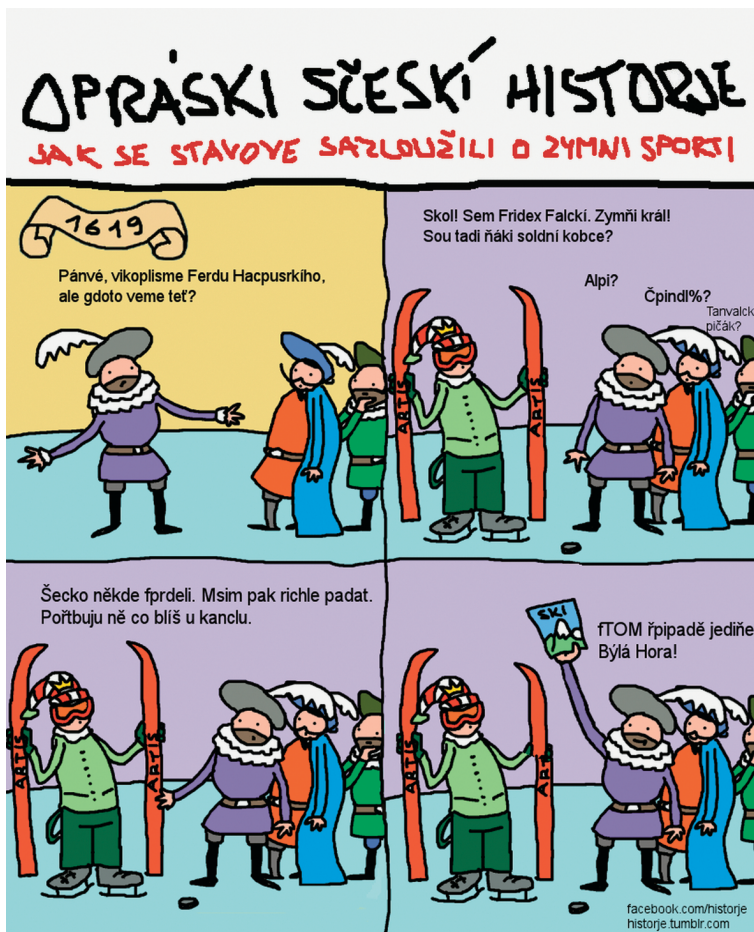
Abb. 1: Der 1619 zum König von Böhmen gewählte „Fridex von der Pfalz“ interessiert sich nach seiner Ankunft in Prag leider nur für den Wintersport... Als sich der „Winterkönig“ über die Entfernung der Alpen und des Riesengebirges von seinem neuen Arbeitstisch beschwert, empfehlen ihm die böhmischen Stände den Weißen Berg.

nur der mehrfachen Darstellungen der an der Mauer zum Schloss Stern heldenhaft letzten Widerstand leistenden „Mährer“), wird hier nicht nur enttraumatisiert, sondern in eine Karikatur verkehrt. Wie erfrischend die ironische popkulturelle Verkehrung traditioneller Geschichtsnarrative auch sein mag, so erscheint die in der Publizistik, im Rundfunk, im Fernsehen und in Social Media – unter aktiver Beteiligung von Wissenschaftlern und Wissenschaftlerinnen – dominierende Entmythologisierung der Schlacht am Weißen Berg inzwischen mehr stereotyp als anregend 14 .