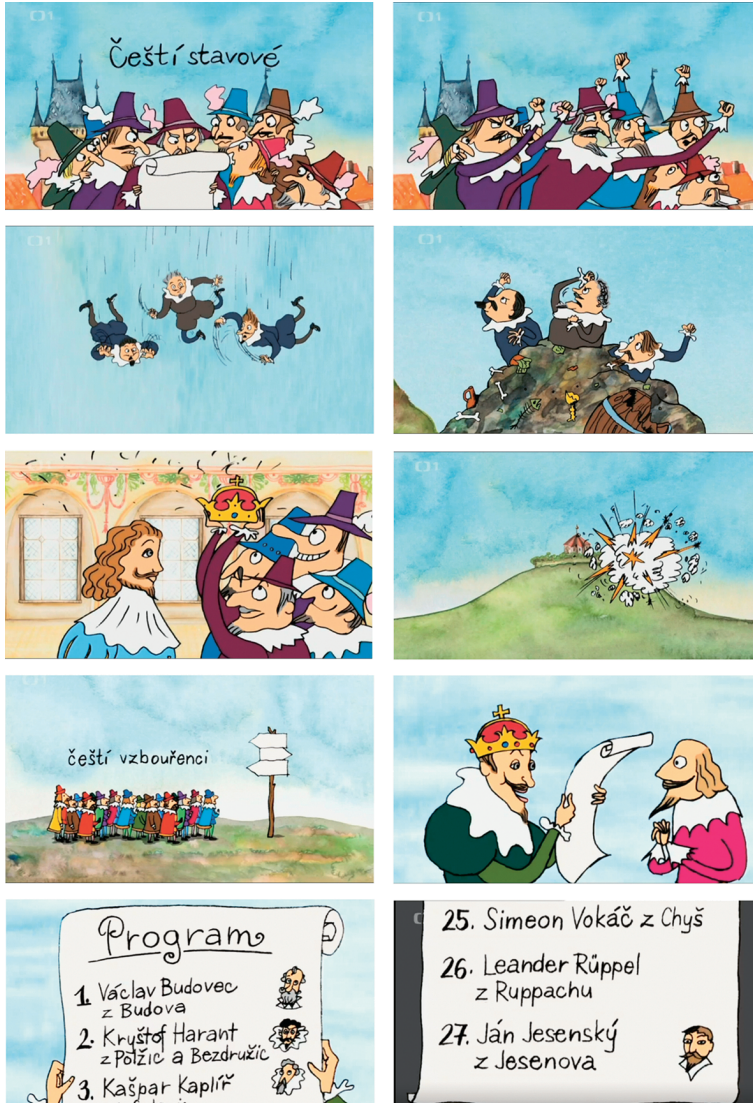
Abb. 2: Ausgewählte Szenen aus der animierten Fernsehserie „Dějiny udatného českého národa“ (Folgen 61 und 62): die erbosten böhmischen Stände; der Fenstersturz; die Krönung Friedrichs von der Pfalz; die Schlacht am Weißen Berg; die böhmischen Aufständischen zittern vor den Konsequenzen; Ferdinand II. korrigiert das „Programm“ der Prager Rebellenexekution, https://www.ceskatelevize.cz/porady/10177109865-dejiny-udatneho-ceskeho-naroda/