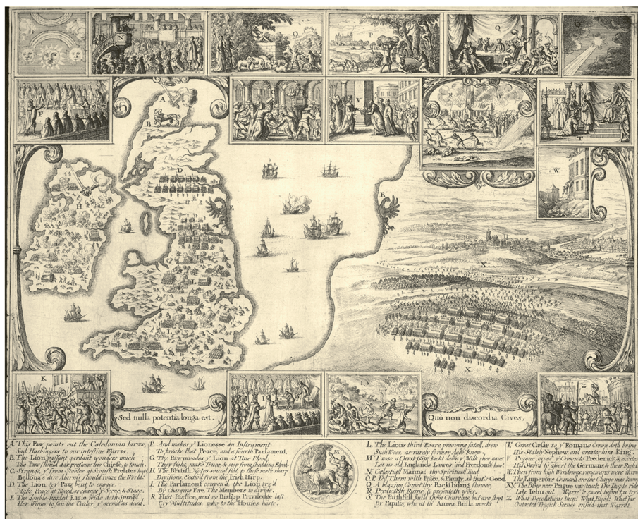
Abb. 6: Wenzel Hollar, Vergleich des englischen Bürgerkriegs mit dem böhmischen Ständeaufstand (1659?). Thomas Fisher Rare Book Library, University of Toronto Libraries, https://collections.library.utoronto.ca/view/hollar:Hollar_k_0632 .