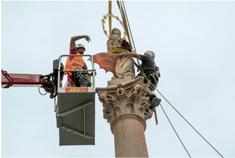
Abb 5: Die Fertigstellung der Replik der Mariensäule am Altstädter Ring in Prag am 4. Juni 2020.

Erinnerungskulturen und aneinander vorbeilaufende Geschichtsdiskurse hinzudeuten. Es wäre zu fragen, inwiefern die Wiedererrichtung der Mariensäule am Altstädter Ring in Prag einen Markstein in der tschechischen „Vergangenheitsbewältigung“ bedeutet – sprich: eine nachträgliche Versöhnung mit der Habsburgermonarchie als einer wichtigen Epoche der tschechischen Geschichte – oder ob wir es eher mit einem Ausdruck jener konservativen Umpolung der tschechischen Vergangenheit zu tun haben, auf die der Brünner Historiker Josef Válka (1929–2017) aufmerksam machte 17 . Die Kritik an diesen Trends – zur banalen Dekonstruktion längst dekonstruierter Mythen, zur unkritischen Übernahme der Perspektive der Sieger und zur tendenziellen Legitimierung verschiedener politischer Machtansprüche der Gegenwart – wurde zwar in der tschechischen Publizistik im Zusammenhang mit dem Gedenkjahr der Schlacht am Weißen Berg bzw. in dessen Folge vorgetragen, blieb jedoch eher marginal 18 .