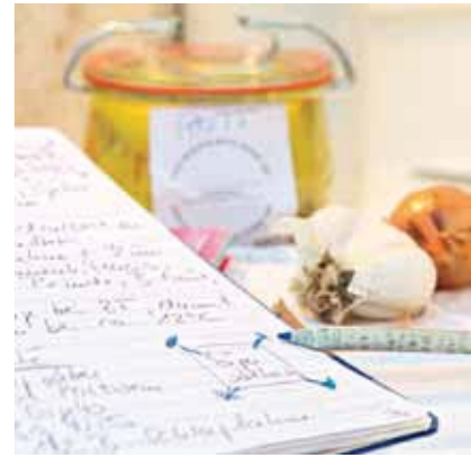
Eine gute Dokumentation hilft, den Überblick zu behalten.

SCHWARZ AUF WEISS Immer alles exakt aufschreiben! Egal, ob Ihre Wurst wunderbar nach „mehr“ schmeckt oder die Gewürzkombination verworfen werden muss: Die Dokumentation der einzelnen Schritte ist wichtig für alle Ihre weiteren Erfolge. Ist etwas gut geworden, haben Sie schwarz auf weiß, was Sie wiederholen wollen. Eventuelle Misserfolge können Sie künftig meiden. Ein kleine Kladde , am besten mit Spaltenaufteilung, sowie ein Bleistift, immer griffbereit, das genügt. Schreiben Sie bereits während des Wurstens alles auf. Besonders bei einer größeren Aktion mit mehreren Schüsseln voll Fleisch, Speck und Gewürzen kommt leicht etwas durcheinander. In der Schüssel vorne links – waren hier die abgewogenen Zutaten für die Bierwurst oder die Lyoner drin? Und hinten? Gemischtes Hack? Geflügelhack? Mit versiertem Auge mag man die einzelnen Fleisch- und Fettsorten durchaus irgendwann auseinander halten, aber auch im Eifer des Gefechts? Ihre Rezepte können Sie nach einer bestimmten Terminologie ordnen, dann finden Sie sie schnell wieder. Am besten, Sie folgen der Einteilung in diesem Buch von den Rohwurstsorten über die Brühwürste bis zu den Kochwürsten.