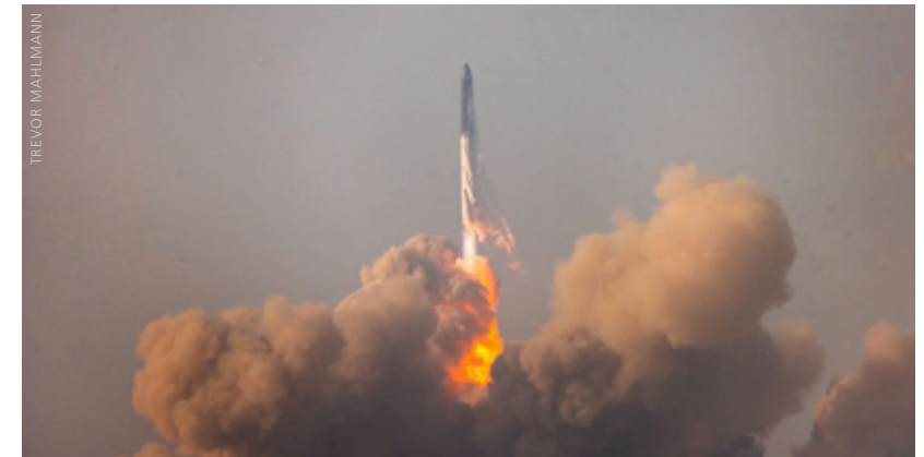
Das Starship steigt aus Rauch und Staub in den Himmel.

Das Starship erzielte eine maximale Höhe von 39 Kilometern und eine Höchstgeschwindigkeit von knapp 2.200 Kilometern pro Stunde. Somit erreichte es etwa doppelte Schallgeschwindigkeit und gewann damit auch gute Messdaten über den Staudruck im transsonischen Bereich, der aerodynamischen Zone, bei dem das Fahrzeug den härtesten strukturellen Belastungen seines Aufstiegs standhalten muss. Die Trümmer des Starship fielen nach der Explosion in den Golf von Mexiko. Trotz des explosiven Endes dieser Testmission schienen die Ingenieure mit den Erkenntnissen aus diesem Start durchaus zufrieden zu sein. SpaceX war schon im Vorfeld der Mission sehr darauf bedacht gewesen, die Erwartungen niedrig zu halten.