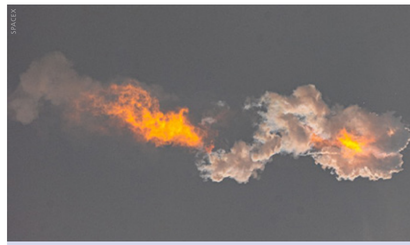
Die Rakete explodiert schließlich in knapp 40 Kilometern Höhe.

Beobachter des Programms nehmen an, dass für den zweiten Flugtest Booster 9 und das Ship 26 eingesetzt werden. Die Missionsziele dürften dieselben sein, wie beim ersten Testflug.