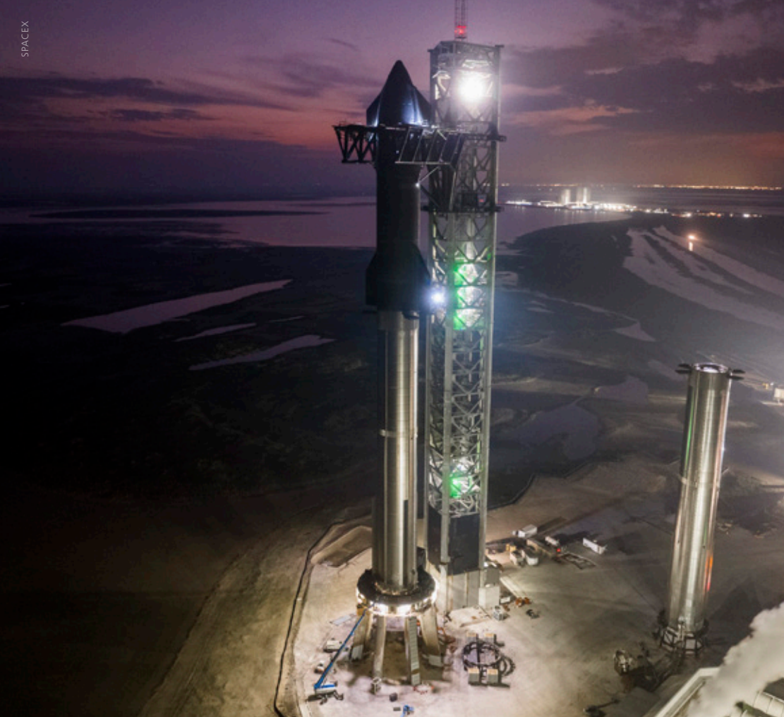
Im Januar 2023 steht ein Starship, also die Kombination aus Super Heavy (Erststufe) und dem eigentlichen Starship (Oberstufe) für die Durchführung von Tests auf dem Startpodest.