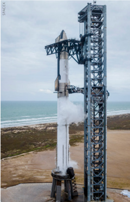
Das voll betankte Starship beim Wet Dress Rehearsal. Wegen der Kälte bildet sich Frost auf der Außenhaut der Rakete.

an der Spitze eines flackernden Feuerstrahls in Zeitlupengeschwindigkeit in den Himmel über der Starbase wucherte. Vom Boden aus war nicht sofort zu sehen, dass einige der 33 Raptor-Triebwerke der Super Heavy-Erststufe schon in den ersten Momenten des Fluges ausgefallen waren. Dass aber etwas nicht stimmte konnte man an der leicht schrägen Fluglage der Rakete erkennen. Gelegentlich gab es einen orangeroten Flash im Feuerstrahl der Motoren, kleinere Teile des Trägers schienen sich von der Struktur abzulösen. Im Laufe der nächsten zwei Minuten erstarben mehrere Triebwerke. Sie waren die Ursache der roten Flashes, die ich beobachtete. Immer, wenn sich eines von ihnen verabschiedete, blitzte es noch ein letztes Mal auf. Als die Rakete schließlich auf den Scheitelpunkt ihrer Flugbahn von knapp 40 Kilometern