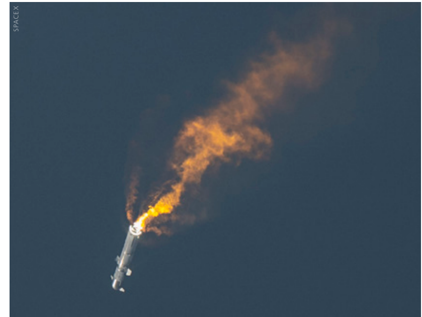
Die Flugbahn-Abweichungen werden größer.

Die neue Rakete, die SpaceX schon in naher Zukunft vollständig wiederverwendbar machen will, soll bis zu 150 Tonnen Fracht in eine erdnahe Umlaufbahn befördern. Für Missionen zu weiter entfernten Zielen wie dem Mond muss SpaceX die Betankung im Orbit beherrschen. Das ist noch nie zuvor in so großem Maßstab und vor allem mit kryogenen Treibstoffen versucht worden.