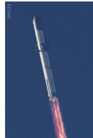
Auf diesem Bild sind die ausgefallenen Triebwerke deutlich zu erkennen

Musk sagte weiter, SpaceX habe diese erste flugbereite Super Heavy-Erststufe mit der Bezeichnung Booster 7 mit einer Abschirmung nachgerüstet, um seine 33 Raptor-Motoren vor Ausfällen benachbarter Triebwerke durch möglicherweise herumfliegende Trümmer zu schützen. „Das ist sehr wichtig“, so Elon Musk wörtlich, „...denn wenn man 33 Triebwerke hat, und eines davon geht kaputt, ist das genauso, als hätte man eine Kiste voller Granaten, und zwar wirklich großer Granaten“. Es war bei diesen Statements unmittelbar nach dem Testflug nicht klar (und ist es immer noch nicht), wie viele der Triebwerksausfälle am Super Heavy-Booster – wenn überhaupt – auf Schäden durch Probleme an benachbarten Triebwerken zurückzuführen waren, oder ob sie nicht möglicherweise schon durch herumfliegende Zementbrocken in der Anfangsphase des Starts verursacht wurden. In einem offiziellen Newsletter kurz nach dem Testflug zeigte sich SpaceX aber recht unbeeindruckt. Das Unternehmen vermeldete, dass...“bei einem Test wie diesem der Erfolg auf dem beruht, was wir dabei lernen. Und heute haben wir wir enorm viel über die Fahrzeug- und Bodensysteme gelernt. Die heute gewonnenen