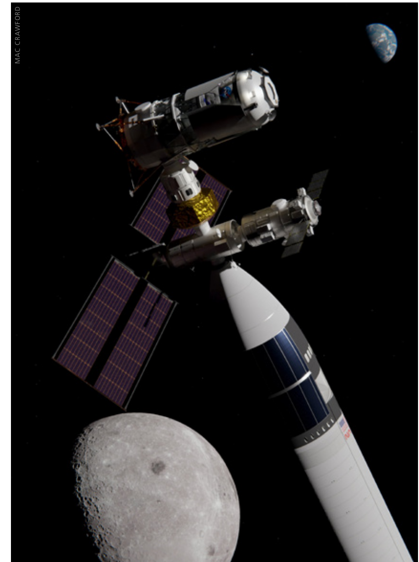
Schon in wenigen Jahren soll das Starship auch für die NASA im Einsatz sein, so wie es diese künstlerische Darstellung mit einer Szene am Lunar Gateway zeigt.

Wenn SpaceX all diese Probleme behebt, und davon kann man ausgehen, sieht man sich die Geschichte dieses Unternehmens an, dann wird es in absehbarer Zeit über die größte vollständig wiederverwendbare Rakete der Welt verfügen. Das Starship hat das Zeug, die Beziehung der Menschheit zum Kosmos für immer zu verändern.