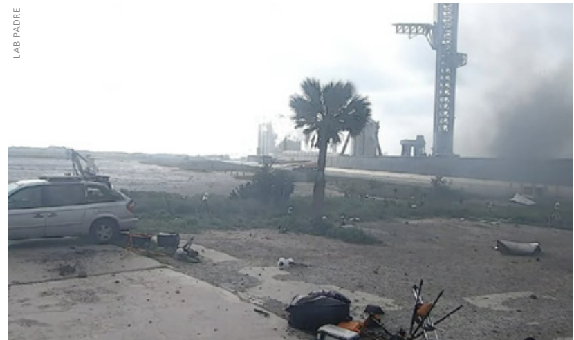
In der näheren Umgebung des Startplatzes sah es aus, wie in einem SF-Endzeit-Movie.

Die startende Rakete, die endlose Sekunden in dieser gigantischen Staubwolke zu verharren schien, bevor sie sich schließlich mit zeitlupenartiger Geschwindigkeit herausschälte, hinterließ unter dem Startpodest einen viele Meter tiefen Krater. Die herumfliegenden Gesteinsbrocken beschädigten die nahegelegene Tank-Farm, verbeulten die Kryo-Behälter und lagen überall auf dem Strand herum. Alle in der Nähe der Rakete installierten Kameras der Fotografen wurden zerstört. Nur bei einigen wenigen konnten zumindest die Speicherkarten gerettet werden, so dass es einige wenige Nahaufnahmen des Starts gibt. Alles in allem wirkte die Szenerie vor allem in der Nähe des Startsockels apokalyptisch. Schäden an der Startrampe im Starbase-Komplex standen schon vor dem Flug ganz oben auf der Liste der Bedenken, die Musk vor dem Starship-Testflug hatte. „Ich würde es schon als Erfolg betrachten“, so meinte er vor dem Start „wenn