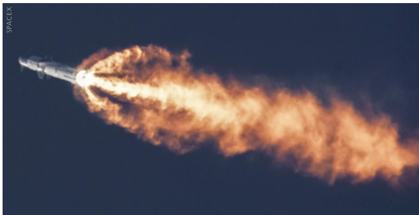
Das Starship gewinnt an Höhe.

Elon Musk meldete schon bald auf Twitter, dass der nächste Start bereits in ein paar Monaten erfolgen könnte. Die Arbeit am nächsten Starship ist jedenfalls weitgehend beendet, die Anlagen sind wieder aufgebaut. Die Verbesserungen wurden vorgenommen. Nun wartet SpaceX nur noch auf die Flugfreigabe der Federal Aviation Administration (FAA).