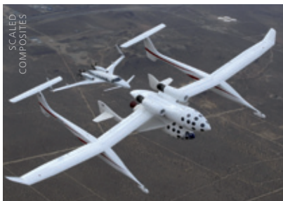
WhiteKnightOne mit SpaceShipOne

flugzeug „WhiteKnightOne“ (WK1). Einer der eigenartigsten und gleichzeitig effektivsten Entwürfe in der Geschichte der Fliegerei. Gleich nach dem Projekt SS1/WK1 nahmen die Ingenieure von Scaled das Vorhaben „SpaceShipTwo“ (kurz: SS2) in Angriff. Größer, schwerer und leistungsfähiger als „SpaceShipOne“ und in der