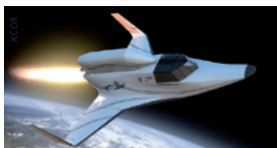
XCOR Lynx Mark 1