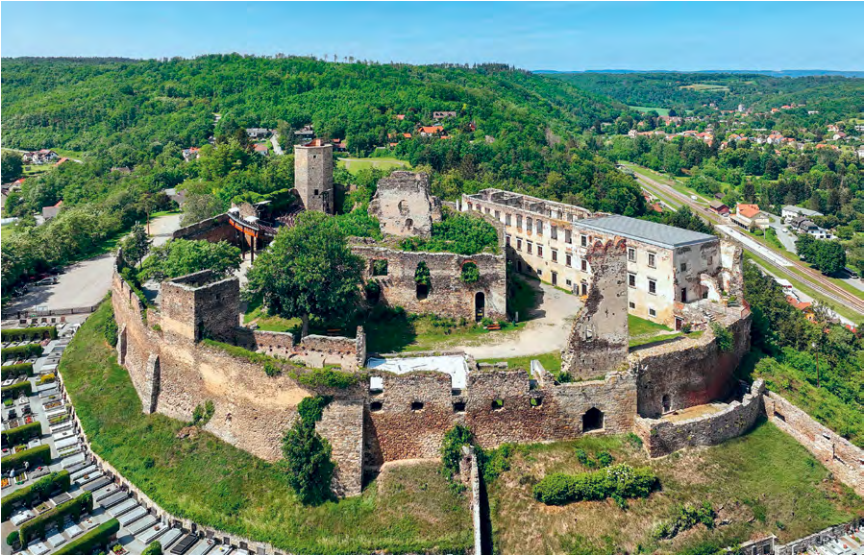
Abb. 2 Burgresidenz Gars am Kamp. Äußere Ringmauer aus dem 11. Jahrhundert um den Palas, der von einer inneren Ringmauer umgeben wird. Rechts der Südturm mit dem Haupttor und der kaum erkennbaren Pankratiuskapelle. Unmittelbar links davon der einstige Rittersaal.