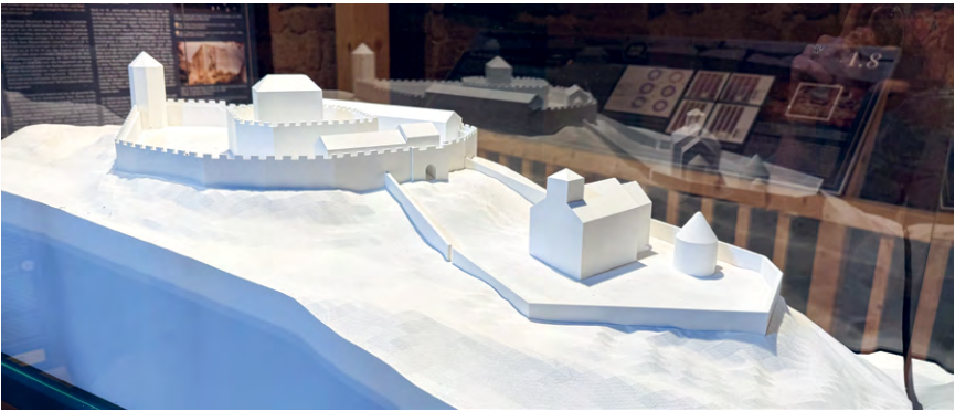
Abb. 3 Modell der Burgresidenz Gars am Kamp zur Zeit von Leopold III. und Agnes. Ausgestellt im Burginneren.