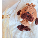
Otto, das Walross Seite 90