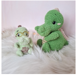
Cash, das Krokodil Seite 74