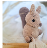
Nuts, das Eichhörnchen Seite 114