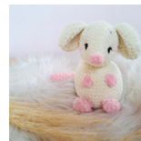
Tilly, die Maus Seite 60