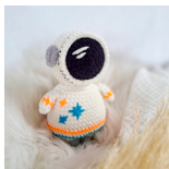
Astronaut Neo Seite 65