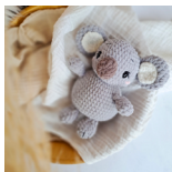
Ellin, der Koala Seite 54