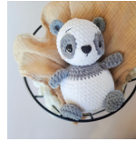
Bao, der Panda Seite 80