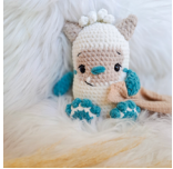
Giggles, der Yeti Seite 85