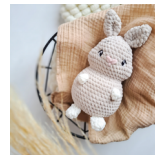
Lilly, das Kaninchen Seite 50