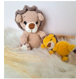
Luan, der Löwe Seite 102