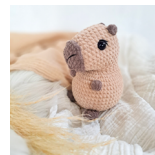
Caipi, das Capybara Seite 70