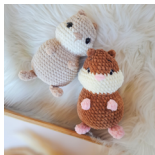
Hubble, der Hamster Seite 46