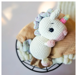
Candy, das Einhorn Seite 108