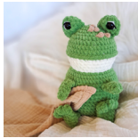
Bufo, der Frosch Seite 36