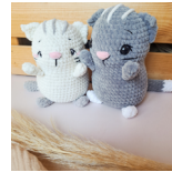
Cleo, die Katze Seite 41