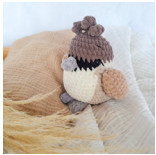
Goldie, der Spatz Seite 97