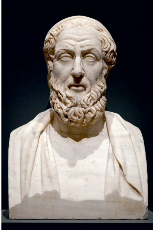
Abb. 4: Porträtbüste von Homer, Marmor, 2. Jh. v.Chr., Ostia, Louvre Museum, Paris

Der Streit entzündete sich an dem Anspruch auf Beute, den jeder der beiden Kontrahenten für sich geltend machte. Im Verlauf der Auseinandersetzung kündigte Achilleus dem ihm übergeordneten Heerführer zornig den Gehorsam auf.