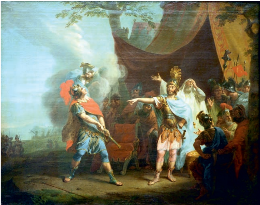
Abb. 3: Johann Heinrich Tischbein, Achilles streitet mit Agamemnon, 1776, Öl auf Leinwand, Hamburger Kunsthalle

Als das griechische Heer im zehnten Jahr die Stadt Troja belagerte, kam es zu einer Auseinandersetzung zwischen dem Atreussohn Agamemnon, dem Heerführer, und dem göttlichen Achilles , dem unbestritten größten Helden im Aufgebot der Griechen.