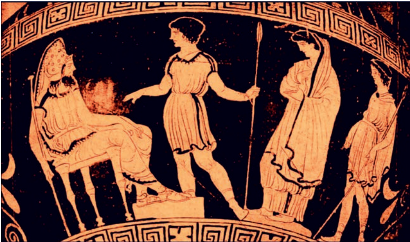
Abb. 5: Antigone vor Kreon, antikes Vasenbild, vermutlich 5. Jh. v. Chr.

Die Sache heißt: zu ehren die, die ungehorsam sind? Die Stadt sagt mir, was ich befehlen muss? Ist es Verfehlung denn, wenn ich in frommer Pflichterfü- llung Herrscher bin? (VV. 730, 734, 744).