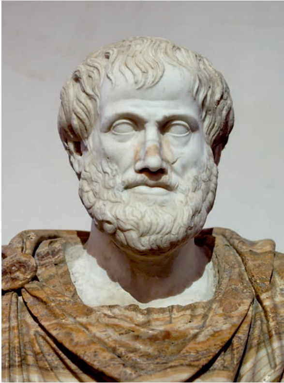
Abb. 2: Büste von Aristoteles, Marmor, Römische Kopie nach dem griechischen Bronze-Original von Lysippos, 330 v.Chr., Palazzo Altemps, Rom

Die Vorstellung von dem, was der Staat zu leisten hat, erschöpft sich nicht in den genannten Aufgaben. Er hatte vielmehr einen Zweck zu erfüllen, den der Philosoph Aristoteles (384–322) folgendermaßen formuliert: