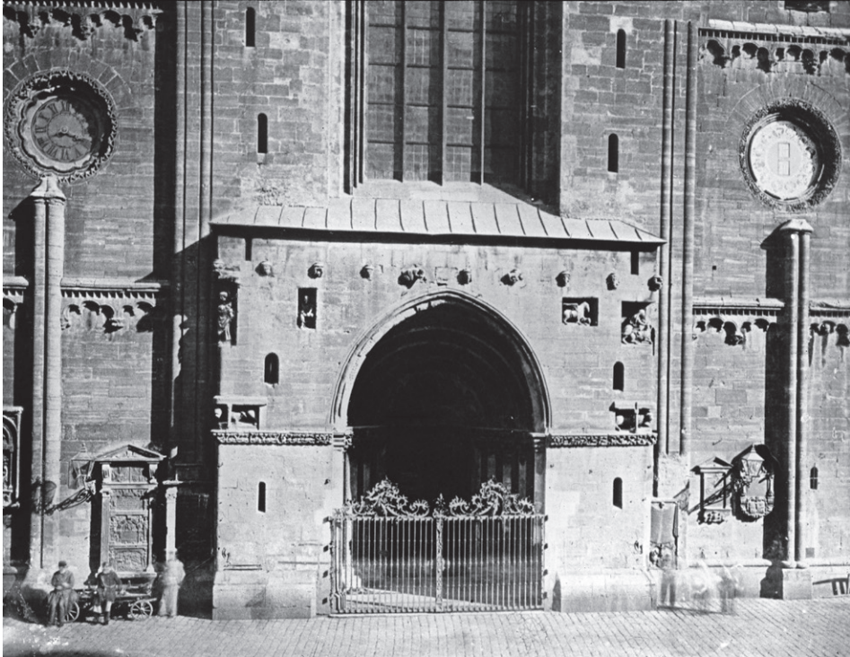
Abb. 2. Wien, Stephansdom, Westfassade, Riesentor, Aufnahme um 1900.

für die Erhaltung der Kirche in ihrer gegenwärtigen Gesamtanlage Sorge zu tragen, meinen Andere, es müsse gleichzeitig an den Ausbau des zweiten Turmes geschritten werden, es müsse die vordere Facade der Kirche, welche eigentlich der Überrest eines früheren Kirchenbaues und in den gothischen Bau nur mechanisch eingeschoben sei, beseitigt und an ihre Stelle eine Facade im gothischen Style neu aufgebaut werden. Wieder Andere, deren Augen durch die stylwidrige Einrichtung der Kirche im hohen Grade beleidigt werden, wünschen in dringender Weise eine durchgreifende stylgemäße Restaurierung im Inneren durch Entfernung der alten und Aufstellung neuer Altäre, durch den Aufbau eines neuen Oratoriums und eines neuen Musikchores, durch Anbringung von gemalten Fenstern im Chore und in den Schiffen. Heider stellt unmissverständlich fest, dass sich die ZK diesen Wünschen [...] in keiner Weise anschließen kann. Bezüglich der Fassade meint er: Man sollte kaum glauben, dass ein solcher Wunsch ernst gemeint sei, welcher eben nur in dem sehr modernen Bestreben einer allgemeinen Nivellierung einen Anhaltspunkt, aber durchaus keine Rechtfertigung findet. Er räumt ein, dass sich die Fassade mehr dem romanischen als dem gothischen Style zuwendet, erklärt aber in der Folge mit einer subtilen Beobachtung ihre Daseinsberechtigung: sie ist ein Kunstwerk und der Zeitstellung nach von dem Baue des Mittelschiffes nicht weiter getrennt, als letzteres