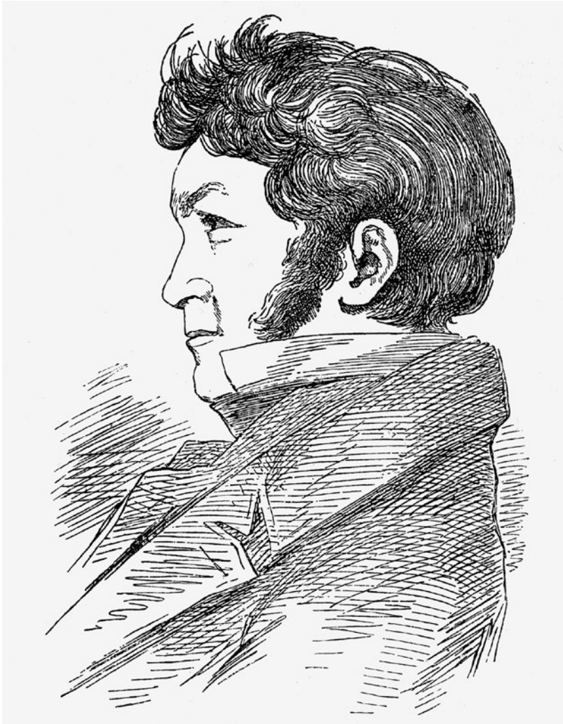
Abb. 1 Ludwig van Beethoven . Holzstich nach einer Zeichnung von Ludwig Ferdinand Schnorr von Carolsfeld (um 1813)

Abschluss dieser Epoche bildete, in den Jahren 1813–14 komponierten Werke, wie die Schlachtensymphonie über den Sieg Wellingtons bei Vittoria und die Kantate Der glorreiche Augenblick , beschwören daher nicht mehr den Geist der »alten Revolution«, sondern geben sich der Hoffnung hin, dass im Anschluss an die Niederringung des Tyrannen Napoleon ein von friedliebenden Idealen beseelter europäischer Völkerbund entstehen würde.