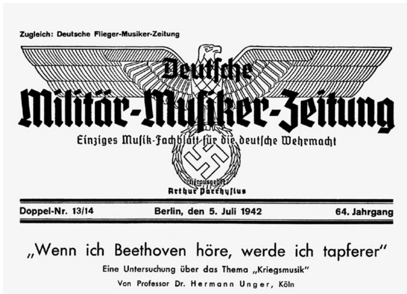
Abb. 3 Titelei einer NS-Zeitschrift (1942)

Noch heroischere Züge nahm das Beethoven-Bild bei den nationalistisch gestimmten Schichten im Ersten Weltkrieg 18 und dann während des Hitler-Reichs an. Statt weiterhin den gründerzeitlichen Bismarck-Beethoven zu beschwören, wurde jetzt im rechten Lager immer stärker der »völkische« Beethoven herausgestrichen, an dem man zusehends die »arische Willenskraft« und das Moment des »Heldischen« betonte, um ihn als einen urgermanischen Bundesgenossen mit »fälisch-nordischen Rassenmerkmalen« im Kampf gegen alles »Undeutsche« und damit Kulturlose, wenn nicht gar Untermenschliche hinstellen zu können. 19 Vor allem zwischen 1939 und 1945, also während des Zweiten Weltkriegs, sollte seine Musik die an allen Fronten für Deutschlands »Größe« kämpfenden Truppen in ihrer »Tapferkeit« im Hinblick auf den militärischen Endsieg bestärken.