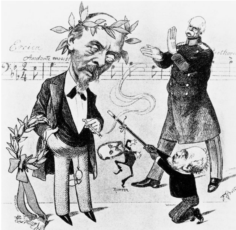
Abb. 2 F. Gaety: Applaus für Hans von Bülow anlässlich der Umwidmung von Beethovens Eroica in eine Bismarck-Symphonie (1892). Neue Berliner Musikzeitung

lichkeit« nach diesem Krieg kurzerhand gegen die positive Devise »Infanterie, Kavallerie und Artillerie« aus. 16 Ja, derselbe Bülow entblödete sich anlässlich eines Konzerts am 28. März 1892 nicht, Beethovens Eroica in eine Symphonie für »Otto den Großen«, den »Fürsten Bismarck«, umzuwidmen, und ließ sogar im Konzertsaal Zettel verteilen, auf denen er dem Thema des ersten Satzes einen »dem allverehrten Kanzler« huldigenden Text unterlegt hatte. 17 Andere deutsche Musikkritiker und Dirigenten sprachen im gleichen Zeitraum – trotz einiger diesen offenkundigen Byzantinismus persiflierenden Karikaturen – sogar vom »Blut und Eisen«-Beethoven oder sahen in ihm die edelste Verkörperung von Friedrich Nietzsches »Übermenschen«. Demzufolge nahm fast niemand Anstoß daran, als Max Klinger 1902 ein Beethoven-Monument schuf, das den Schöpfer der 9. Symphonie als einen nackten Heros darstellte, der sich auf einem imperial wirkenden Thron niedergelassen hat.