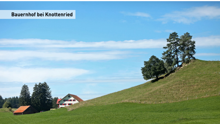
Bauernhof bei Knottenried

sich plötzlich im Unterallgäu wieder – ein Umzug, der nicht bei allen auf Begeisterung stieß. Historisch betrachtet passte man die Grenzen des Allgäus dem Zeitgeist an.