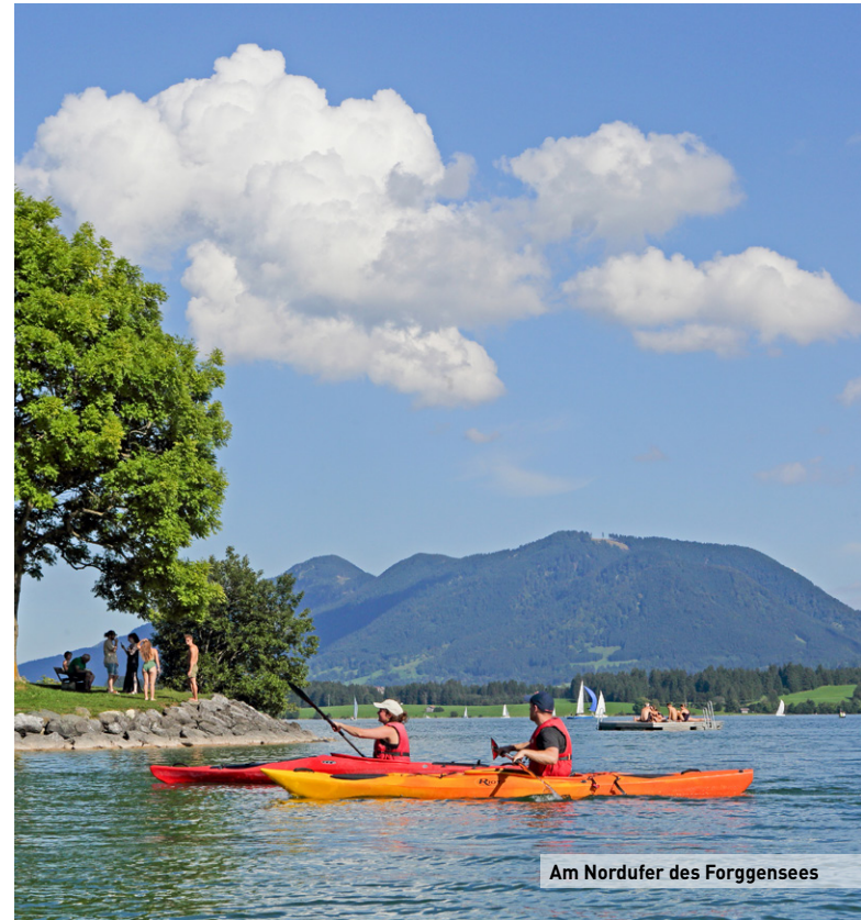
Am Nordufer des Forggensees

Hinweis: Aus Gründen der besseren Lesbarkeit wird auf eine geschlechtsneutrale Differenzierung verzichtet. Entsprechende Begriffe gelten im Sinne der Gleichbehandlung grundsätzlich für alle Geschlechter. Die verkürzte Sprachform beinhaltet keine Wertung.