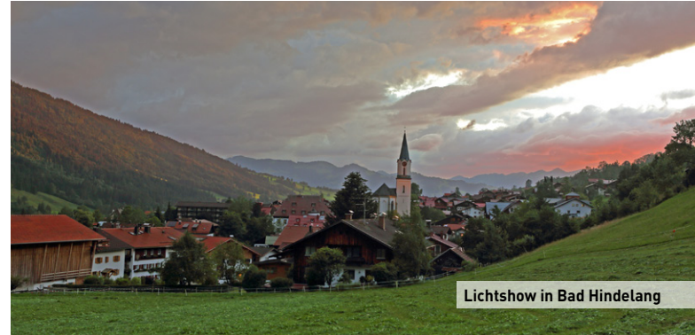
Lichtshow in Bad Hindelang

Und dann sind da noch die Allgäuer selbst – sorry, eigentlich sollten sie an erster Stelle stehen. Sie erfüllen so manches Klischee mit Bravour – sei es die Trinkfestigkeit oder ihre farbenfrohen Trachten, sei es die Hartnäckigkeit oder das Erfindertum. Manchmal scheint die Wirklichkeit sogar Stereotype zu über-