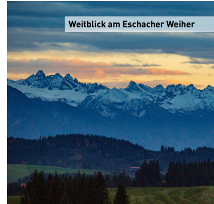
Weitblick am Eschacher Weiher

Der Name „Allgäu“ selbst gibt Rätsel auf: Einige leiten ihn vom althochdeutschen „alb“ für Berg und „gau“ für Landschaft ab, während andere vermuten, dass „Gäu“ von „Ge-au“ kommt, also eine Landschaft mit mehreren Auen.