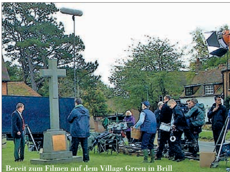
Bereit zum Filmen auf dem Village Green in Brill