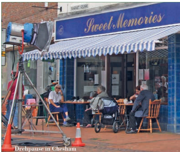
Drehpause in Chesham