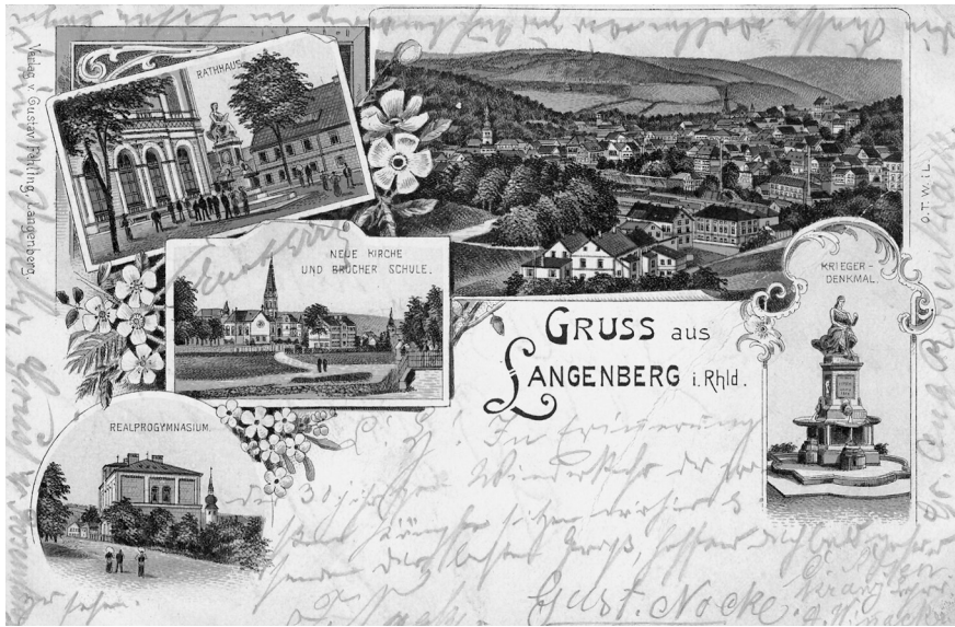
Abbildung 1: Gruß aus Langenberg, vor 1914.