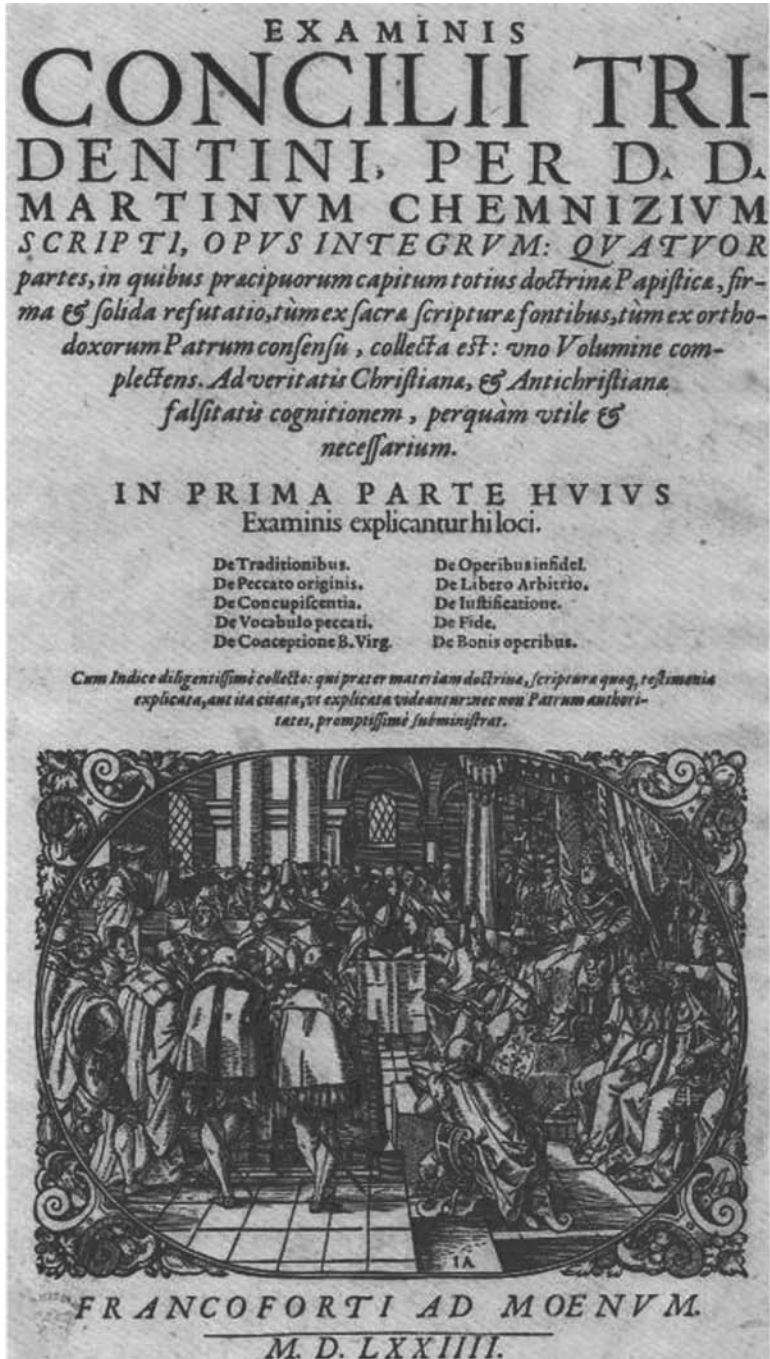
Abbildung 2: Martin Chemnitz, Examen Concilii Tridentini, Frankfurt am Main 1574.